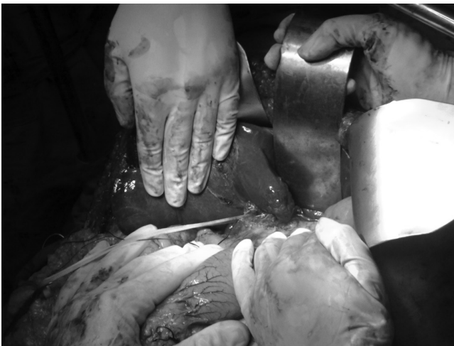
FIGURA 2 – Adenoma hepático pequeno no segmento IV

(Figura 2). Houve tentativa de enuclear a massa a partir do parênquima hepático circundante. No entanto, uma vez que era muito suave sangrando prontamente e aderindo-se à direita no diafragma, veia hepática direita e volumosa afluenta da veia hepática média, foi realizada hepatectomia direita guiada. Uma vez que a mobilização total de lobo direito parecia perigosa, foi preferida abordagem anterior, como descrito por Capussotti et al. 2 Enucleação simples foi realizada para tratar a lesão do segmento IV.