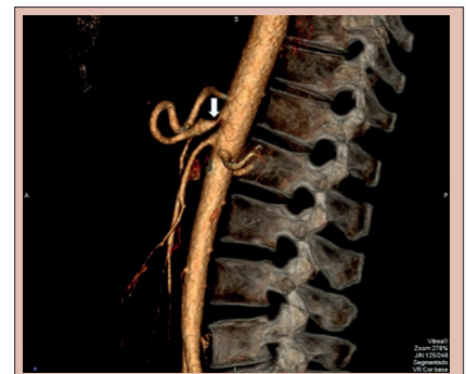
Angiotomografia mostrando estenose intensa do segmento proximal do tronco celiaco (seta).

DESCRIPTORIOS: Síndrome do ligamento arqueado mediano. Síndrome da compressão do tronco celiaco. Artéria celiaca. Cirurgia laparoscópica.