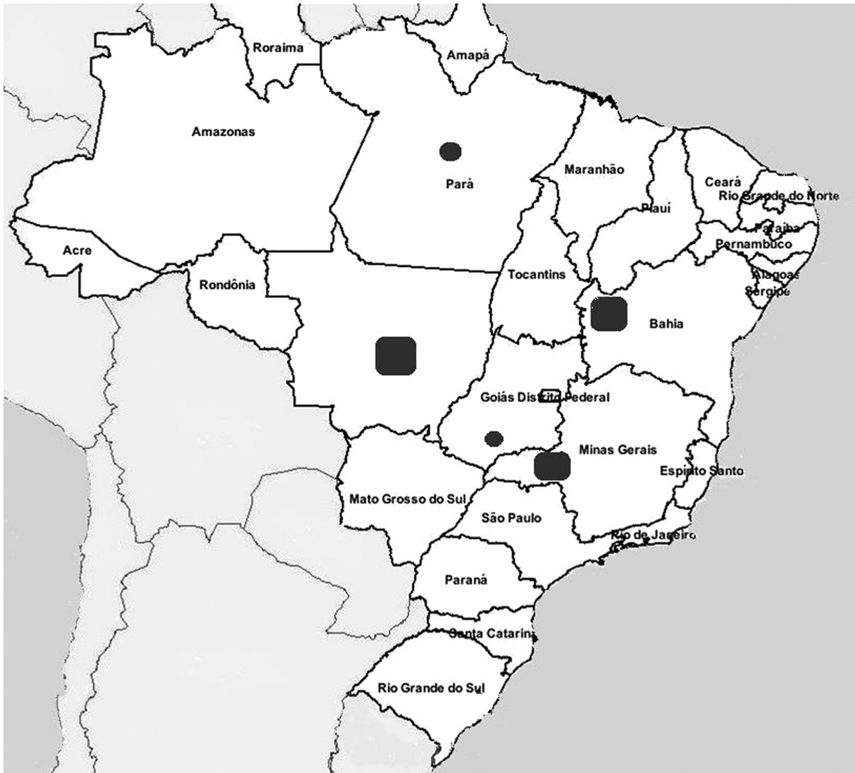
Figura 2 Regiões do Trabalho de Campo e dos Surveys da Pesquisa