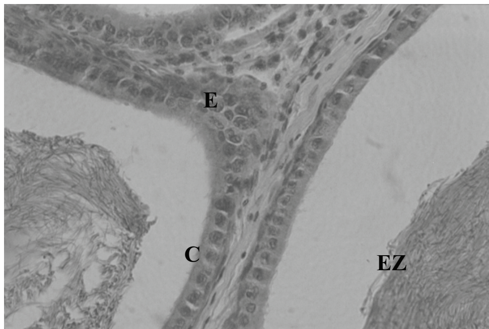
Figura 3. Fotomicrografia do epidídimo de rato submetido ao tratamento durante 30 dias consecutivos por via oral com EHA das partes aéreas de Mentha crispera (1,0 g/kg). E - epitélio; EZ - espermatozóide; C - cápsula (Obj. 40x).

20 dias, além de reduzir o número e motilidade dos espermatozóides e a massa dos testículos e epidídimo.