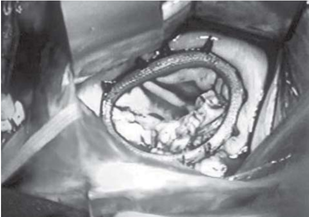
Fig. 4 – Colocação de um anel de Carpentier, usado em casos de dilatação do anel mitral

Seis pacientes tinham concomitantemente lesão da valva aórtica: cinco foram submetidos à operação de Ross e, um, à substituição da valva aórtica por homoenxerto. Utilizamos em todos os casos homoenxertos criopreservados.