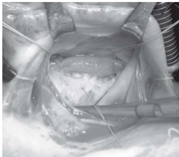
Fig. 3 – Sutura do enxerto, no anel e na borda do folheto posterior