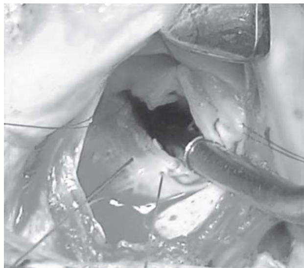
Fig. 1 – Desinserção do folheto posterior do anel. A incisão deve se estender de comissura a comissura

Ao final da operação, o enxerto de pericárdio deve constituir o corpo do folheto posterior ao qual o folheto anterior se cooptará durante a sístole. É importante que a área de