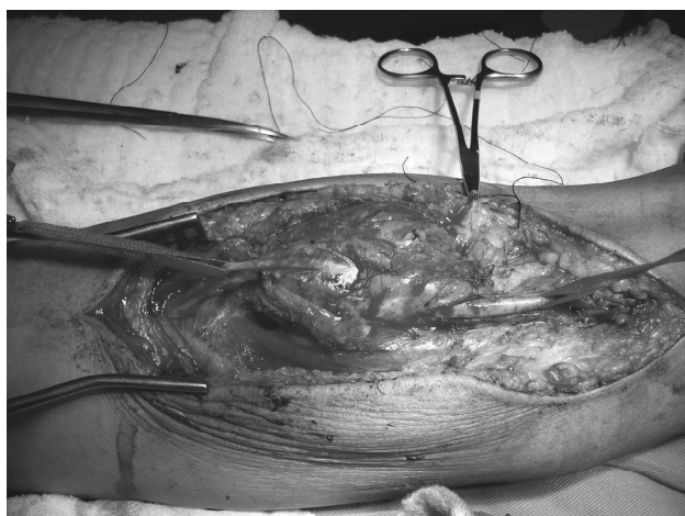
Fig. 2 - Imagem cirúrgica do aneurisma da artéria braquial direita, comprometendo sua bifurcação. Encontra-se reparada com fita cardíaca, à direita, a artéria braquial proximal ao comprometimento aneurismático

anterógrado em artéria radial e ulnar. No exame histopatológico, observou-se à microscopia: artéria apresentando perda de fibras elásticas da camada média, associada à deposição de substância mucóide; extensa hialinização; adventícia com moderado infiltrado linfomolecular; espessamento dos vasovascularum . Conclusão: Transformação mucóide da camada média, aneurisma da artéria braquial.