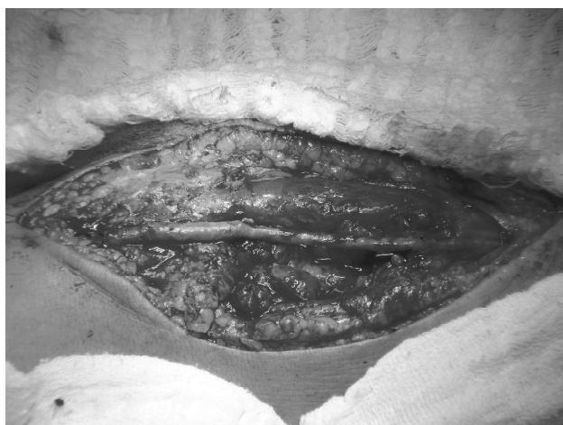
Fig. 3 - Aspecto final após ressecção do aneurisma com interposição de enxerto de safena reversa em localização braquio-radial