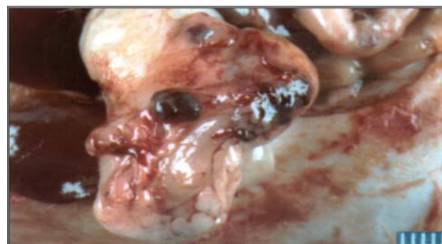
FIGURA 3 - Aspecto macroscópico da regeneração de um fragmento de baço implantado da cavidade peritoneal.

Nos casos observados de migração do implante esplênico na cavidade peritoneal as regenerações ocorreram distantes do local implantado, como na grande e na pequena curvatura gástrica e no omento maior. Quando se compararam os elementos histológicos do tecido esplênico regenerado com o do baço normal, não se notou diferença estatística significativa entre os grupos A e B. Os resultados do estudo histológico que analisou a reação entre a área receptora e os fragmentos implantados e regenerados, não evidenciaram diferença estatística significativa em relação aos grupos A e B. Os resultados do estudo citológicos em