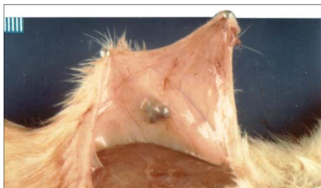
FIGURA 2 - Aspecto macroscópico da regeneração de quatro fragmentos de baço implantados na tela subcutânea.