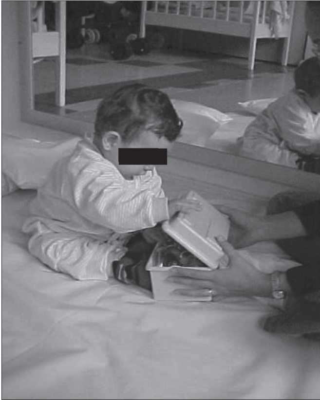
Figura 1 – Retirada de um brinquedo inserido em uma caixa.