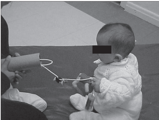
Figura 3 – Retirada de quatro pequenos brinquedos de um tubo de papelão unidos por um barbante.

do programa) e três dias após a retenção (pós-retenção). O teste de retenção foi o critério que indicou se o bebê lembrou ou não das tarefas do teste inicial. Na primeira avaliação (antes de iniciar o programa interventivo), as tarefas foram propiciadas ao bebê até que o mesmo as realizasse com sucesso (4,7) . Dados dicotômicos, “sim” e “não”, foram