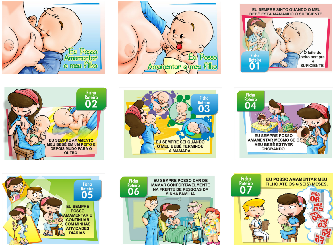
Figura 1. Versão inicial das figuras contidas no álbum seriado sobre autoeficácia em aleitamento materno, apresentada aos juízes experts.

Cada figura foi catalogada em ordem numérica crescente e de acordo com seu subtema (Fi1, Fi2, Fi3, Fi4, Fi5, Fi6 e Fi7); (FR1, FR2, FR3, FR4, FR5, FR6 e FR7). Além das sete figuras, havia duas opções de capa, das quais os juízes sugeriram a com melhor ilustração em conformidade com o tema proposto pelo álbum seriado.