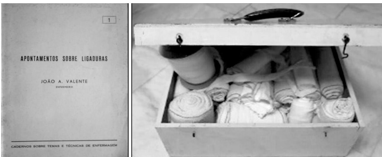
Figura 3. Manual de ligaduras e caixa de ataduras.

eram pouco desenvolvidas. Na Figura 3, mostramos a capa do Manual do Enfermeiro João Valente, conhecido entre os enfermeiros portugueses de várias gerações, e a caixa onde armazenava as faixas crepe para utilizar nas aulas, hoje, patrimônio histórico da Escola Superior de Enfermagem de Coimbra (7) .