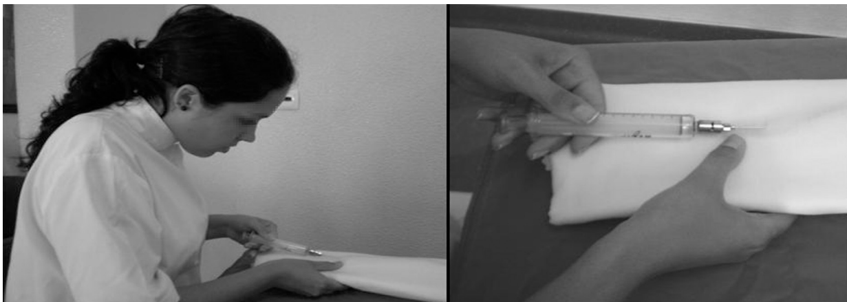
Figura 2. O treino de punção no garrote.

mobilização do paciente no leito. Em Portugal, no caso do enfaixamento, esta foi uma área de forte desenvolvimento, com manuais específicos e inúmeras aulas inteiramente dedicadas a essa prática. Afinal era o recurso disponível nos tempos em que o adesivo não imperava e em que as técnicas de hemostase durante a cirurgia