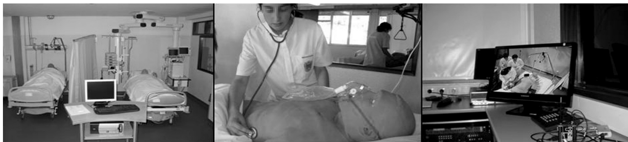
Figura 5. Experiência clínica simulada: espaço, equipamento e simulador de paciente.

o trabalho em equipe, o pensamento crítico, o julgamento clínico e a tomada de decisão, entre outros.