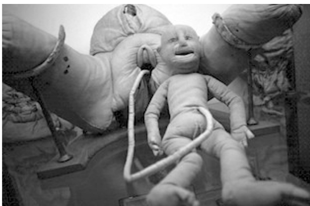
Figura 4. Manequim de Parto de Mme Coudray.

Precocemente, foram percebidos os benefícios no treino das competências técnicas dos enfermeiros em ambiente simulado, antes de sua execução, pela primeira vez, em uma pessoa real. A própria indústria auxiliou com a criação de modelos anatômicos nem sempre realistas, mas, que foram sistematicamente suprindo as necessidades das escolas nessa área. O manequim de parto (Figura 4), criado por Mme Coudray, ainda no Séc. XVII, faz parte do espólio do Museu Flaubert da História da Medicina (CHU – Hôpitaux de Rouen) e evidencia a necessidade dos profissionais de ter um modelo para treino nessa área específica.