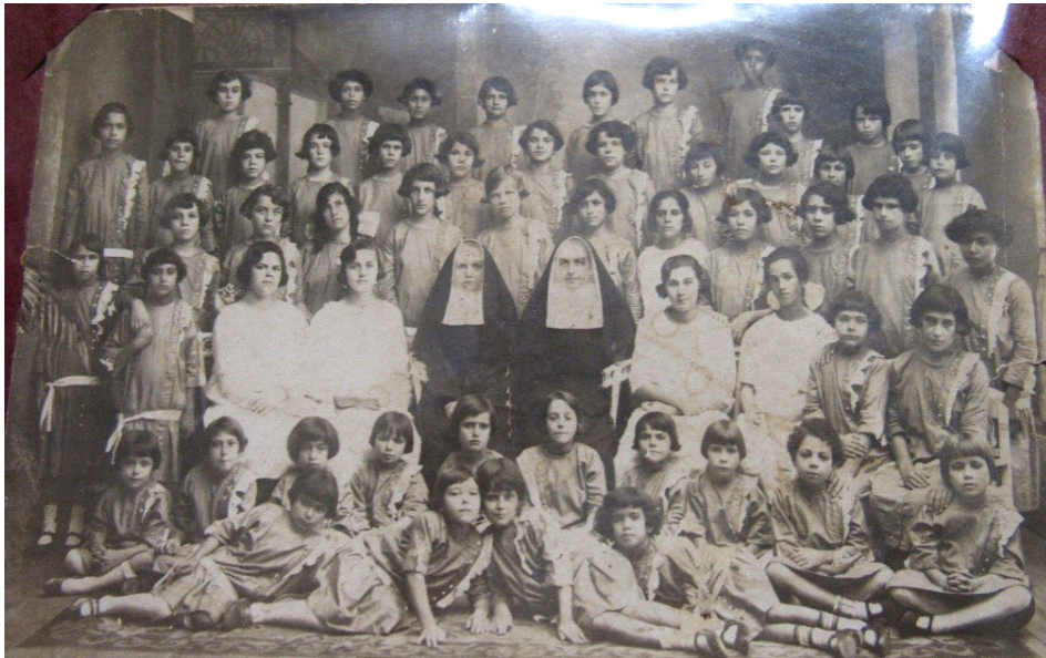
Figura 1 – Asiladas das Irmãs da Divina Providência na década de 1920