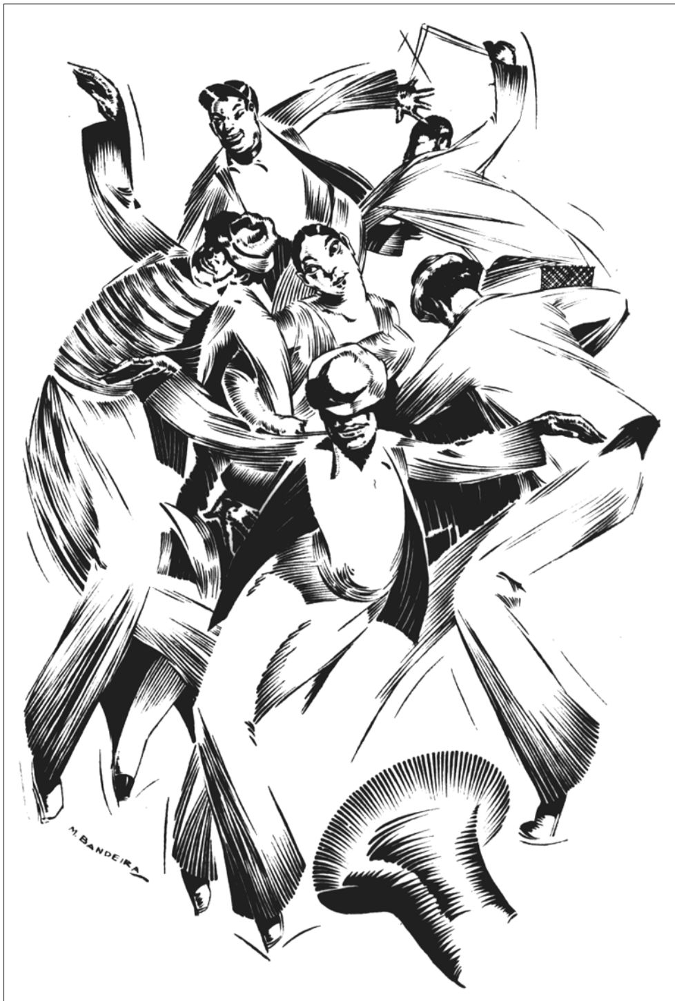
O frevo pernambucano: desenho de Manuel Bandeira, extraído de Anuário de Pernambuco para 1934, Recife, PE.