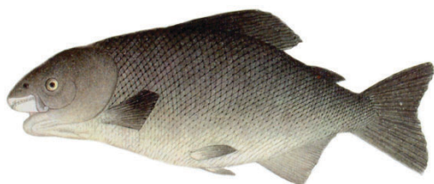
Pirarucu (no alto), pacu (à esq.) e tambaqui (em cima).

Em relação aos problemas da Amazônia que devem ser estudados por nós, reuni, em 1975, um grupo de pesquisadores das principais organizações científicas da Amazônia a fim de realizarmos o 1º Planejamento Estratégico do Inpa. Depois desse fizemos mais seis “Planejamentos Estratégicos” no Inpa, sempre buscando os temas prioritários que deveríamos atacar. Levantamos, por exemplo, quais as principais doenças, pois a Amazônia está cheia de doenças que não são estudadas. Há uma análise, penso que do Instituto Oswaldo Cruz, mostrando que entre Belém e Manaus existem mais arbovírus do que todos aqueles conhecidos no resto mundo Pois bem, então essa é uma grande pesquisa a ser feita. (Arbovírus são vírus transmitidos pelo ar, pelos insetos ou pelos ventos.)