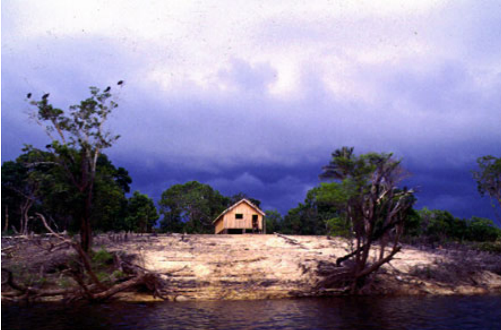
Casa ribeirinha no alto à margem do rio Amazonas.