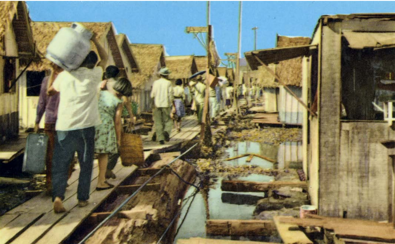
Detalhe da Cidade Flutuante no início dos anos de 1960. Cartão Postal de Manaus.

O delegado, ao notar que os gringos estavam interessados na sua opinião, aproveitou para exibir sua sabedoria regional.