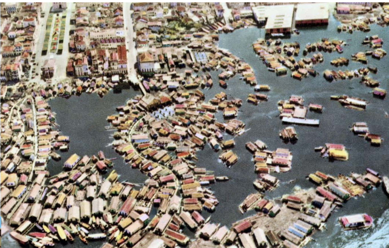
Vista aérea da Cidade Flutuante no início dos anos de 1960. Cartão Postal de Manaus.

“A vida do homem nessa região é uma realidade anfíbia, daí esse pessoal não se intimidar com a fúria do sobe e desce das águas. Eles vão construindo suas casas palafitas, e não só elas, mas toda e qualquer atividade: lojas, postos de gasolina, quitandas, botecos que, estruturados sobre toras e ancorados em pontos que facilitem o comércio, funcionam em tempo de cheia ou vazante. Aqui é a Manaus que nunca dorme”.