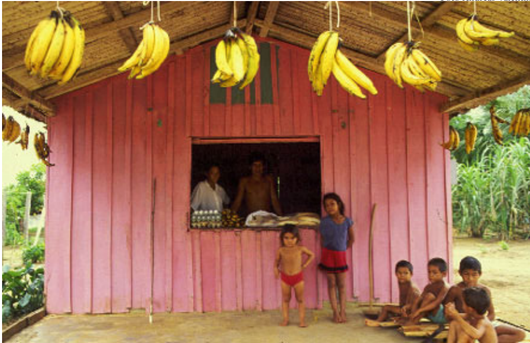
Crianças ribeirinhas em frente à mercearia de produtos regionais.

As famílias da classe média só rompiam os limites do seu gueto, o centro da cidade, quando necessitavam sair de Manaus por via aérea, em direção ao aeroporto de Ponta Pelada. O acesso principal era feito ao atravessar três pontes de ferro, a primeira, a segunda e a terceira, que é mais bela e monumental. A primeira ponte significava sair de um mundo já conhecido, atravessar o igarapé de Manaus para vislumbrar o Palácio Rio Negro – a sede do governo, antiga residência de um rico seringalista alemão, que mantinha um zoológico particular. Dizem que lá aconteciam festas do arromba, com eunucos, hipnotizadores, odaliscas, uma verdadeira Sodoma e Gomorra. Depois, veio a crise da borracha e ele teve que vender tudo, até os sapatos e as gravatas. Tudo isso fazia parte das mil e uma noites das lendas manauaras.