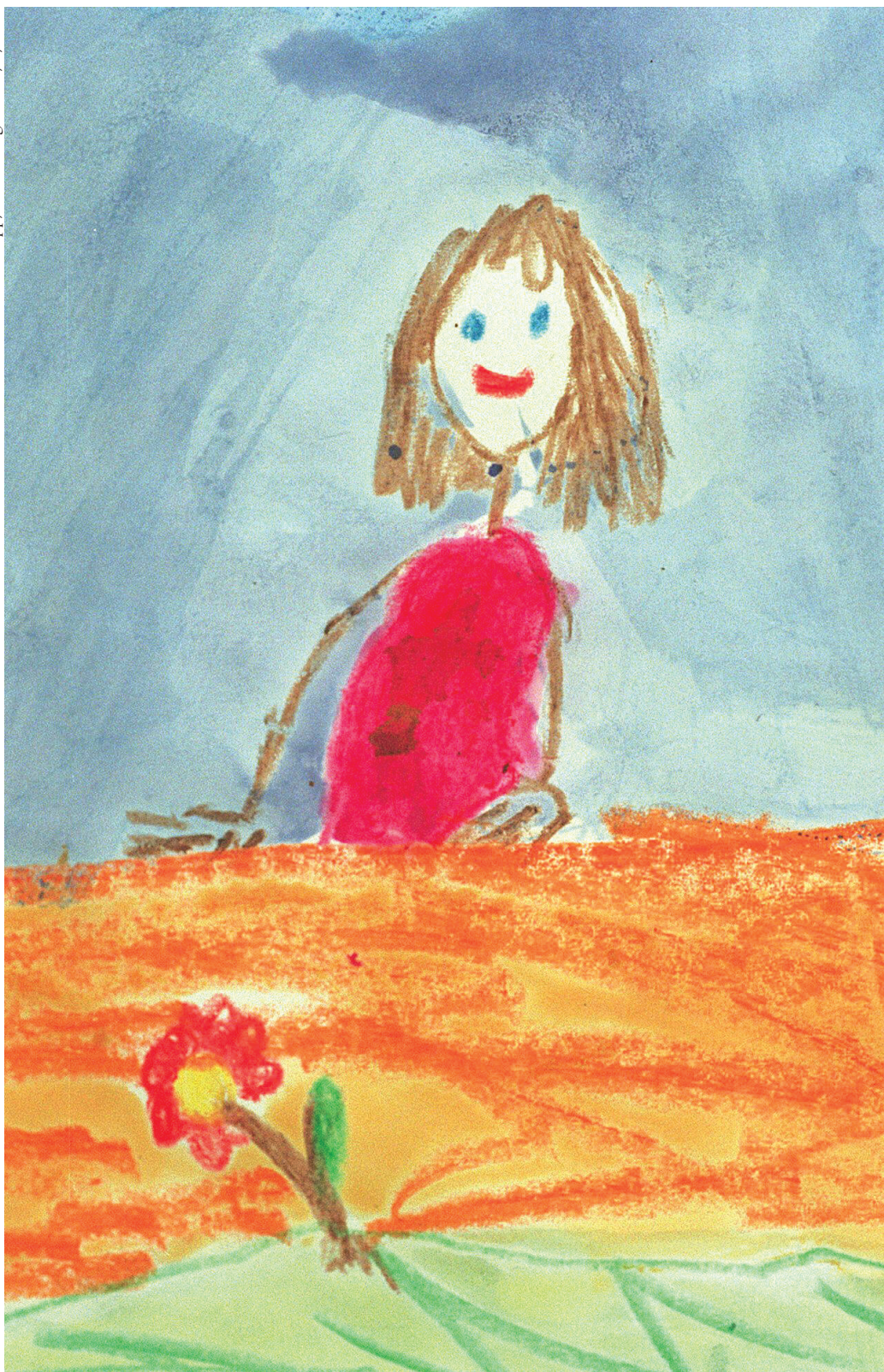
Desenho feito por criança numa escola de Ensino Fundamental.