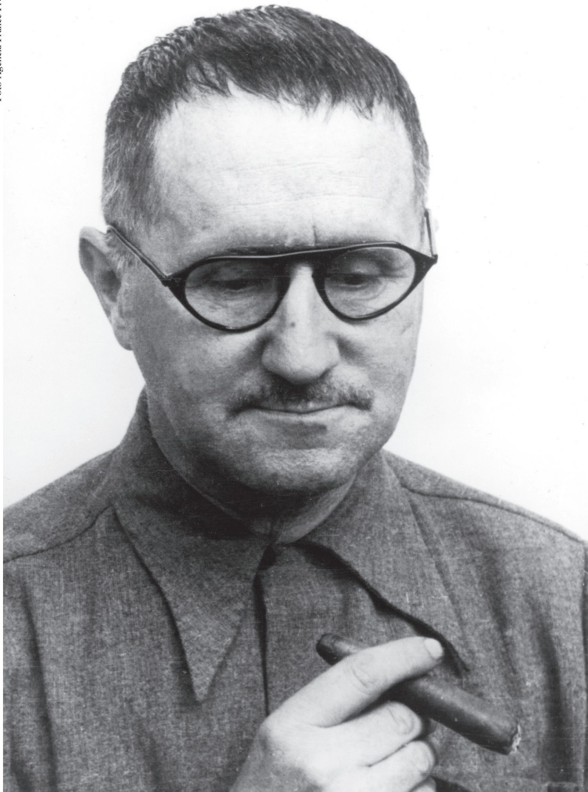
Para B. Brecht, o rádio deveria sair da esfera do fornecimento e organizar o ouvinte como fornecedor.