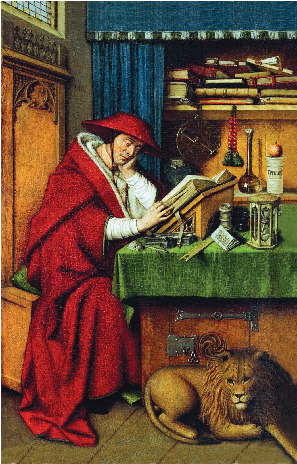
São Jerônimo em seu gabinete, c. 1435, Jan Van Eyck, óleo sobre pergaminho.