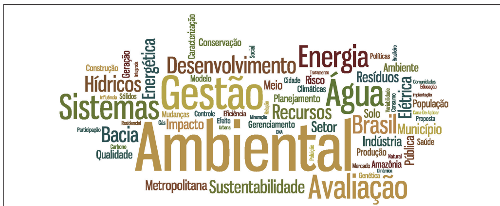
Figura 1 – Nuvem de Termos baseada nos títulos das teses e dissertações defendidas na USP entre junho de 1992 e setembro de 2011, abordando assuntos ligados a Biodiversidade, Governança e Agenda 21, Economia verde e Mudanças climáticas.

A distribuição dos assuntos dos trabalhos foi organizada em uma nuvem de termos, expressa na Figura 1.