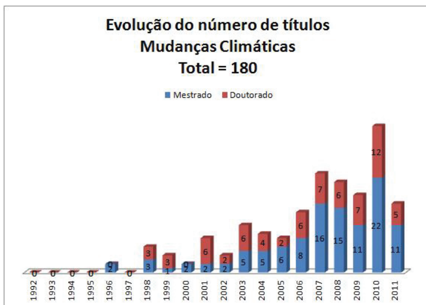
Gráfico 1 – Evolução do número de títulos de mestrado e doutorado defendidos nos Programas de Pós-Graduação da Universidade de São Paulo entre junho de 1992 e setembro de 2011.

O Gráfico 1 mostra a evolução crescente no número de títulos defendidos na USP desde a realização da Rio 92.