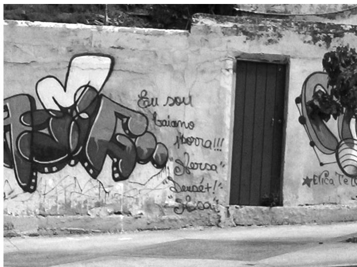
Grafite no bairro Nordeste de Amaralina. Salvador-BA, 2006.