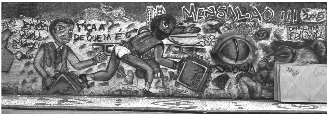
Grafite na Rua Carlos Gomes. Salvador-BA, 2005.