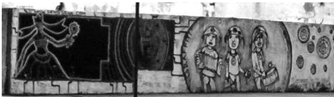
Grafite na Av. Manoel Dias da Silva. Salvador-BA, 2006.