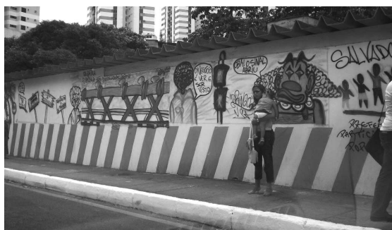
Grafite no Vale dos Barris. Salvador-BA, 2006.