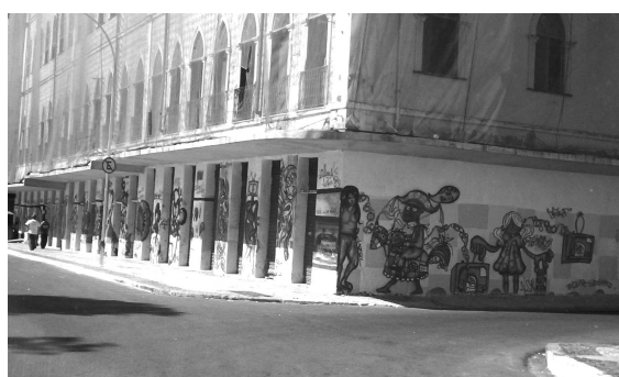
Grafite no Largo do Mercado Modelo. Salvador-BA, 2006.