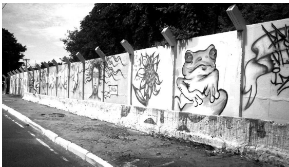
Grafite na Av. Antonio Carlos Magalhães. Salvador-BA, 2006.