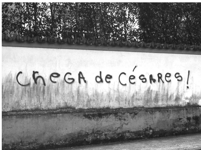
Grafite no bairro da Graça. Salvador-BA, 2005.

coloridas e de formas diversas. Surgiu como uma mídia alternativa, usada pelos negros e hispânicos americanos. Os jovens usavam essa forma de expressão para divulgar idéias, ideais e até óbitos. A diversidade de formas e cores desses símbolos (são códigos próprios de grupos) passa a constituir assinaturas e ícones identitários de grupos, usados para demarcar seus territórios.