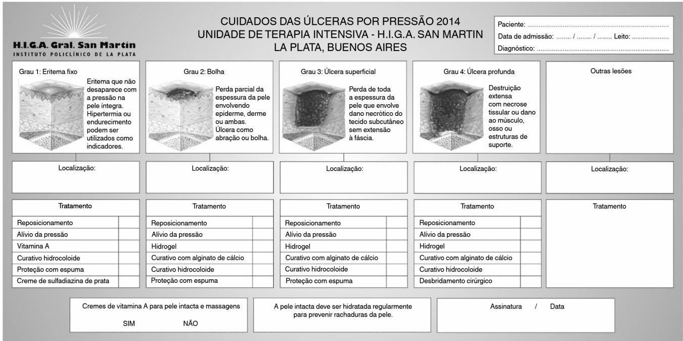
Figura 1 - Formulário desenvolvido para monitorar e controlar as úlceras por pressão.

Todos os membros da equipe foram educados quanto a considerações éticas relativas ao uso de fotografias para finalidades educacionais e terapêuticas, e tomou-se grande cuidado para evitar que se incluíssem nas fotografias qualquer aspecto que pudesse identificar o paciente.