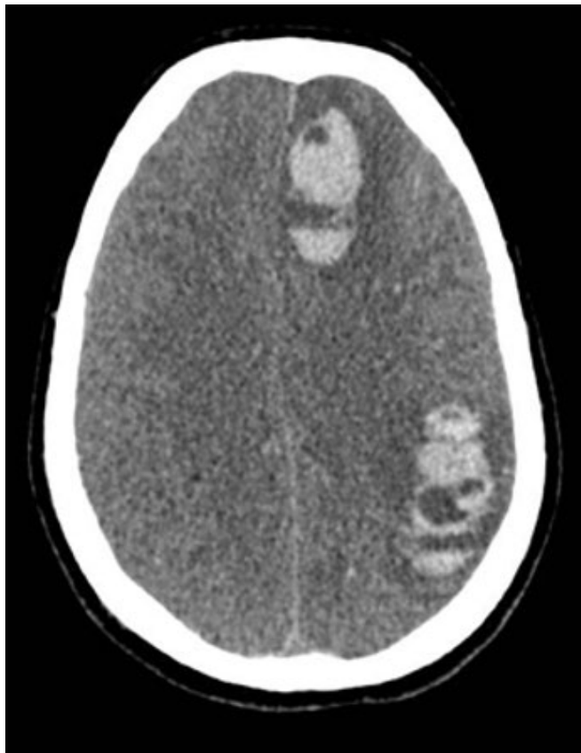
Figura 2 - Tomografia de crânio, obtida no quinto dia pós-operatório (e quarto pós-oxigenação por membrana extracorpórea). Sinais de edema cerebral difuso, hematoma subdural, hematomas intraparenquimatosos e apagamento dos sulcos entre os giros corticais hemisférios cerebrais.

oxigenação durante 10 minutos com fração inspirada de oxigênio ( FiO_2 ) de 1,0 em ambos os dispositivos de suporte e redução do sweep flow reduzido a 0,5L/minuto (Tabela 2). A VMI foi interrompida, tendo sido instituída oxigenoterapia suplementar (6L/minuto) via tubo orotraqueal. No primeiro minuto, detectou-se hipoxemia importante a despeito de oxigenoterapia suplementar e, conforme recomendado, aumentou-se o fluxo da ECMO-VA, com recuperação dos parâmetros fisiológicos aceitáveis para o teste. Estrita monitoração para a presença de movimentos respiratórios foi realizada durante 10 minutos, e amostras sanguíneas para gasometria arterial - pré e pós-teste - foram coletadas, evidenciando incremento da pressão parcial de dióxido de carbono ( PaCO_2 ).