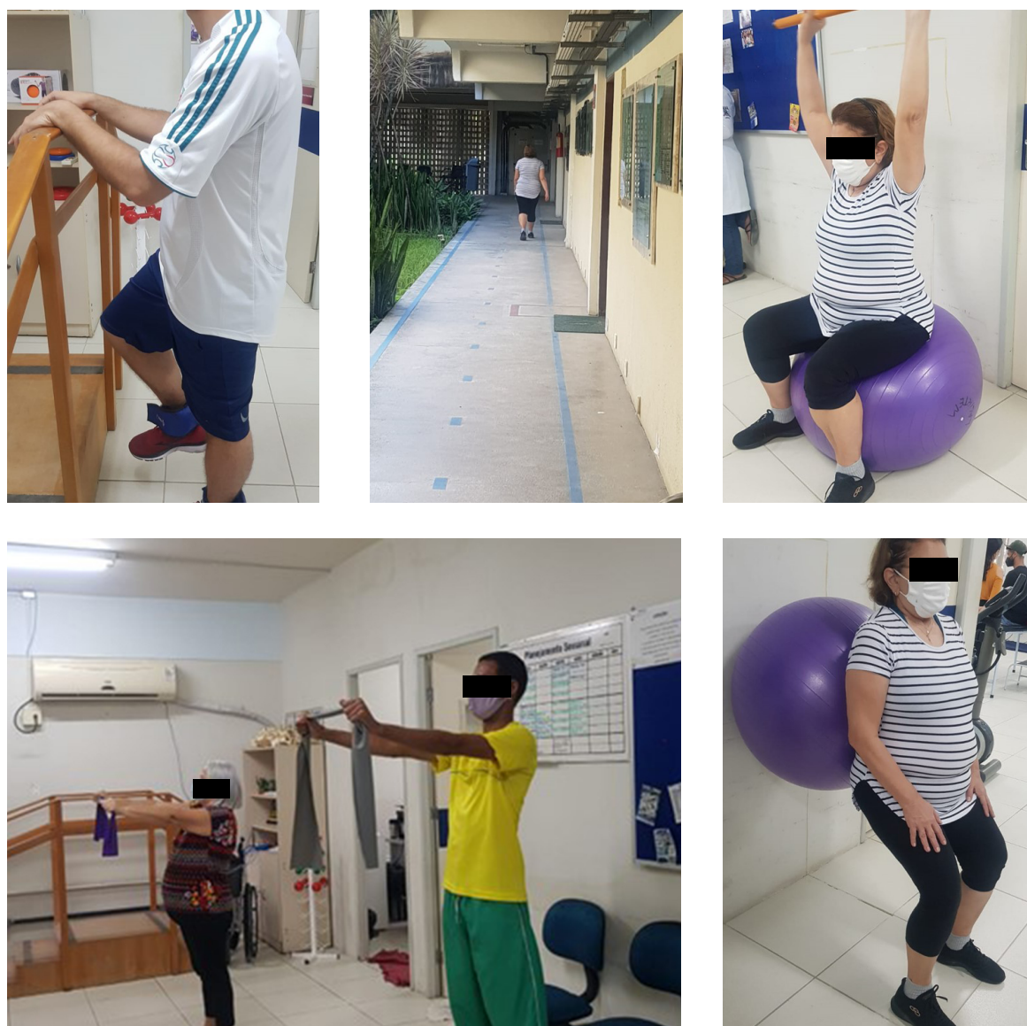
Figura 1 - Estações do protocolo fisioterapêutico de multicomponentes.