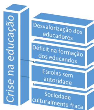
Figura 2 – Representações sobre a crise na educação

respondentes trataram o assunto a partir de uma cadeia de problemas que afetam certos atores, conforme mostra a Figura 2: