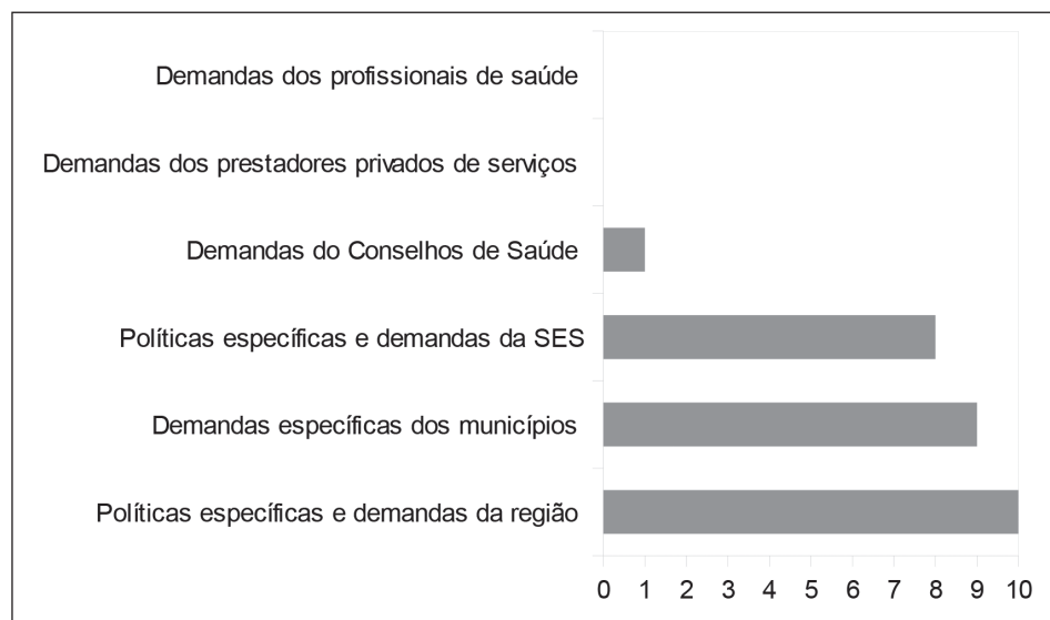
Gráfico 3. Fatores que influenciaram a pauta de discussão dos CGRs no período de 2009 a 2011 segundo percepção dos Coordenadores Regionais– Rio de Janeiro, 2011