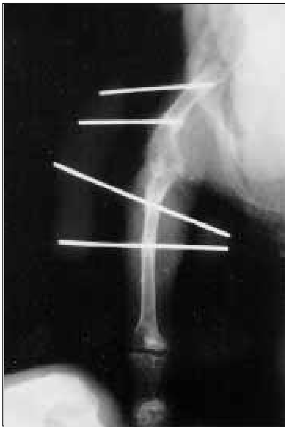
Figura 2 - Redução fechada e fixação esquelética externa tipo II em pombo doméstico ( Columba livia ). Aspecto radiográfico demonstrando o momento adequado para a remoção do fixador esquelético externo. Note o desaparecimento da linha de fratura (seta).

iatrogênica durante a inserção dos pinos, indicando assim que este método pode ser utilizado em aves com porte similar ao deste experimento sem que ocorram tais complicações.