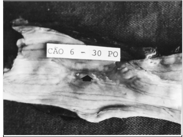
Figura 2 - Aspecto macroscópico do esôfago cervical de cão decorridos 30 dias de pós-operatório da integração enxerto-esôfago. Observa-se a reconstituição da mucosa esofágica, permanecendo apenas uma pequena cicatriz (seta).

Em animais submetidos ao reparo esofágico, HERMRECK & CRAWFORD (1976) observaram que, nas esofagocoloplastias, houve fístula em 42% dos casos, e, nas esofagogastroplastias, em 17,8%. Neste experimento, a ausência de fístulas, abscessos e deiscência dos pontos de sutura, contribuiu para a eficiência do método cirúrgico empregado. Observações semelhantes foram citadas por DALECK et al. (1988) e CONTESINI et al. (1995), embora tenham utilizado, respectivamente, peritônio