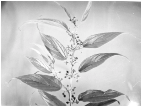
Figura 1 - Intoxicação espontânea por Trema micrantha em caprino. Ramo da árvore apresentando floração e frutificação. Novembro, 2000.