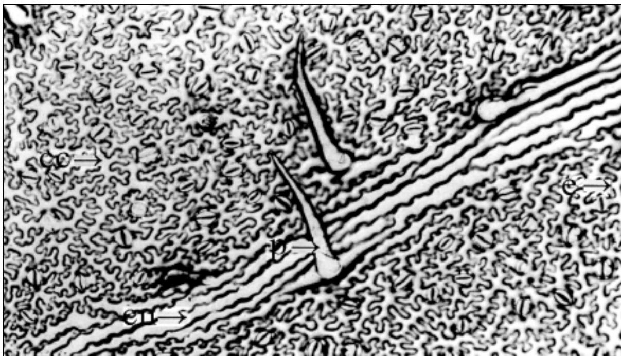
Figura 1 – Vista frontal da face abaxial (aumento 200x) de folíolo principal do clone SMIJ461-1 de batata. cc= célula comum da epiderme, cn= célula que recobre a nervura, p= pêlo, e= estômato. Santa Maria, RS, 2003.

Dentre as técnicas estudadas, a de impressão da epiderme em lâmina foi a única que possibilitou a avaliação adequada de todos os clones de batata analisados. Permitiu observar claramente diferenças de frequência de pêlos e estômatos e de tamanho de pêlos entre clones e faces do folíolo, podendo ser também usada para determinar os tipos de pêlos e estômatos presentes