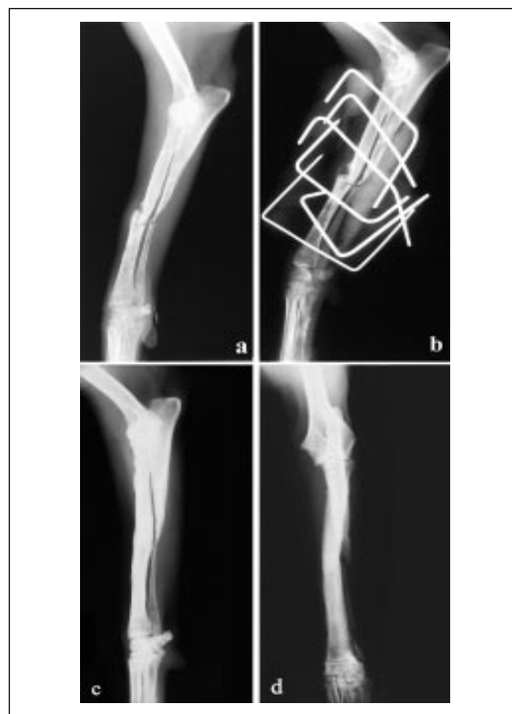
Figura 1 – Cão 1 portador de não-união de fratura diafisária média do rádio e ulna esquerdos com seis meses de evolução. Imagens radiográficas em posição lateral no pré-operatório (a) e pós-operatório imediato (b), e em posições lateral (c) e craniocaudal (d) 1 ano e 6 meses após a remoção do fixador. Nota-se o bom alinhamento do rádio e a não-união da ulna (c, d).

Optou-se pela configuração tipo II porque os pinos utilizados eram lisos e, por isso, proporcionam menor estabilidade na interface pino-osso (ANDERSON et al., 1997). Apesar dos pinos inevitavelmente penetrarem os músculos na face lateral (GORSE, 1998), não se detectaram complicações associadas a esse fato. Especialmente em cães de porte pequeno, o formato retangular do rádio dificulta a inserção dos pinos da face medial para lateral e