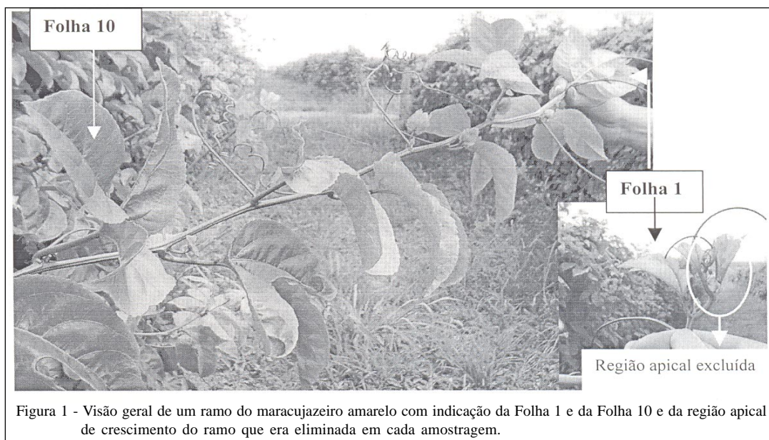
Figura 1 - Visão geral de um ramo do maracujazeiro amarelo com indicação da Folha 1 e da Folha 10 e da região apical de crescimento do ramo que era eliminada em cada amostragem.

quantidade de flavonóides na fração. Na quarta etapa, esses extratos foram diluídos com 8mL de metanol: água na proporção 2:1 e injetados 30 \mu l em cromatógrafo líquido Shimadzu equipado com coluna C-18. As condições cromatográficas foram: fluxo de 0,8mL, fase móvel constituída por solvente A (ácido fórmico 2%) e solvente B (acetonitrila), gradiente de eluição: 0-10 minutos 15% de B em A, 10-40 minutos 15-30% de B em A e de 40-45 minutos 30-15% de B em A.