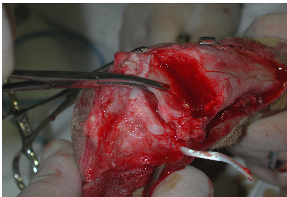
Figura 2 - Imagem fotográfica ilustrando momento da remoção da cartilagem articular e do osso subcondral para posterior fresagem e utilização como substituto ao enxerto autólogo esponjoso em cão.

procedimento foi realizado com broca e motor de baixa rotação. O procedimento de retirada da cartilagem foi considerado terminado quando não havia cartilagem evidente nem presença de sangramento do osso