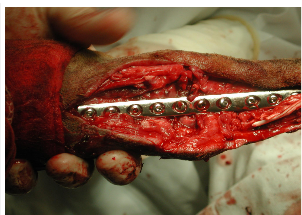
Figura 3 - Imagem fotográfica do momento da osteossíntese com placa e parafusos, já introduzidos os subprodutos da fresagem do osso subcondral como substitutos ao enxerto esponjoso autógeno em um cão.

Conforme descrito por JOHNSON (1980), DENNY & BARR (1991), LI et al. (1999), WHITELOCK et al. (1999), GUILLIARD et al. (2001), a técnica de artrodese foi utilizada em pacientes com lesões decorrentes de quedas ou saltos de alturas