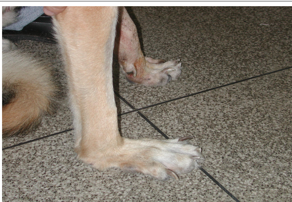
Figura 1 - Imagem fotográfica de articulação rádio-cárpica direita de cão apresentando hiperextensão articular, submetido posteriormente à artrodese.

osteotomia da superfície articular do rádio com serra óssea pneumática a fim de retirar toda a cartilagem, expondo e retificando a superfície para a melhor artrodese (Figura 2). Em sete articulações, este