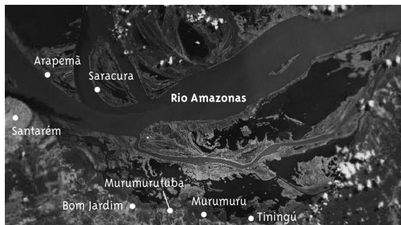
Figura 1 - Localização das comunidades quilombolas estudadas