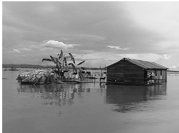
Enchente em Arapemã.

da história. Nos terrenos alagados, a maior parte do cultivo se perde, tornando-se escassos os alimentos e produtos do extrativismo. As habitações, em sua maioria, vêm sofrendo enchentes, obrigando as famílias a construírem assoalhos que acabam se tornando confinamentos para poder sobreviver (ver fotos) (Hurtado Guerrero, 2006). Associa-se a isso a inadequação das condições de saneamento, especificamente as relacionadas aos dejetos sanitários que na ocasião das enchentes, ficam expostos, e à presença de animais mortos, que contaminam os rios, aumentando o risco de morbidades nos moradores.