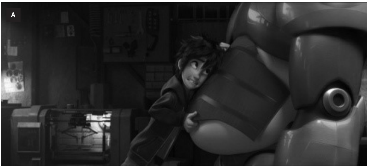
Figuras 3a e 3b – Baymax: forma/versão final.

O corpo de Baymax passa, então, a contar com estruturas rígidas que configuram formas que remetem a representações de grupos musculares hipertrofiados, com contornos bem definidos. A linguagem fílmica - com determinados enquadramentos, como o contra-plongée , quando a câmera filma o objeto de baixo para cima - contribui para representar os atributos de grandiosidade, força e poder (Figura 3b).