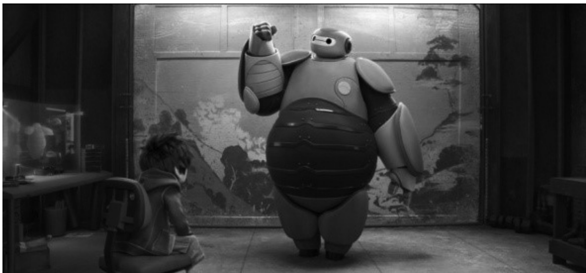
Figura 2 – Baymax: forma/versão intermediária

No entanto, as cenas e situações que envolvem o personagem continuam impondo-lhe as mesmas dificuldades, restrições, limitações; e os mesmos desafios e constrangimentos. Mantêm-se latentes os imaginários negativos vinculados ao sobrepeso e à obesidade; e repete-se a abordagem de tratamento cômico. Baymax materializa, assim, em seu corpo, uma exposição preconceituosa e caricaturada do obeso e da condição de sobrepeso/obesidade.