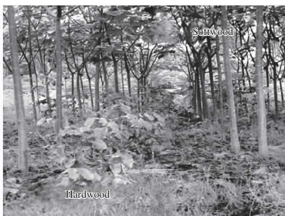
Figura 2. Exemplo de utilização de árvores de madeira branca leve, softwood , para fornecer sombra e proteção às madeiras nobres, hardwood .

A proposta em si parece um tanto simples, porém é sabido que diversos problemas poderão ocorrer, daí a necessidade de se envolver profissionais de diversas áreas de atividades. Por exemplo, um problema previsto se refere à herbivoria de jovens animais da floresta, que torna as árvores recém plantadas suscetíveis à ação predatória de suas folhas por animais silvestres como roedores e cervos e também por animais domésticos como bovinos e caprinos. Uma das soluções adotadas por caboclos na Amazônia para isolar suas roças deste tipo de ataque pode ser aplicada na silvicultura proposta no Fênix: uma cerca viva de espécies de tronco espinhoso seria plantada em todo perímetro da plantação, como por exemplo a palmeira pupunha ( Bactris gasipaes ). A proximidade