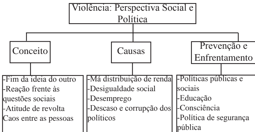
FIGURA 1 - CLASSE 1 - VIOLÊNCIA/PERSPECTIVA SOCIAL E POLÍTICA

Conforme pode ser visualizado na figura1, a classe 1, denominada VIOLÊNCIA: PERSPECTIVA SOCIAL E POLÍTICA é composta por três subclasses: conceito, causas e enfrentamento/prevenção.