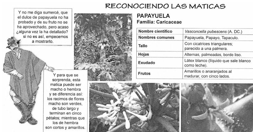
Imagen 3

Esta tensión y consecuente subordinación redundante en las definiciones que se utilizan en la cartilla. Mientras las del experto, ese estudioso invisible, son de carácter técnico, específico, que no son puestas en cuestión y se asumen como certeras. 13 Las definiciones que hace Cándido, se presentan a través de un lenguaje informal, intentando relacionar las definiciones que da el experto con referentes más cercanos, a partir de versos o coplas que recita. Veamos esto en la imagen 3: