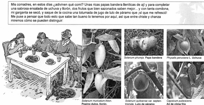
Imagen 4

A través de los dispositivos del lenguaje y gráficos pudimos encontrar que se presenta un contenido como accesorio, que se instrumentaliza para intentar