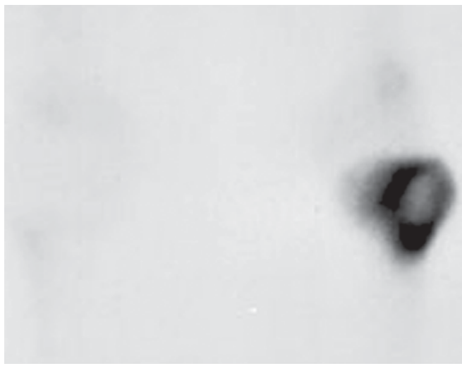
Exemplo de "sinal da rosquinha" em exame de cintilografia óssea de um TCG no terço proximal da tíbia esquerda

Esporadicamente o TCG pode evoluir com metástase à distância, sendo o pulmão o local mais acometido, porém com evolução indolente.