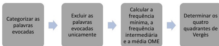
Figura 3. Fluxo com as etapas para determinar os quatro quadrantes de Vergès.

Quadro 3. Cálculos solicitados pelo programa EVOC para a criação dos quatro quadrantes de Vergès.