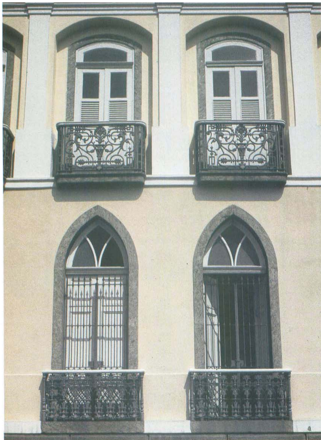
Fachada anterior. Detalhe dos gradis em ferro, de aberturas e de arcos neoclássicos e neogóticos.