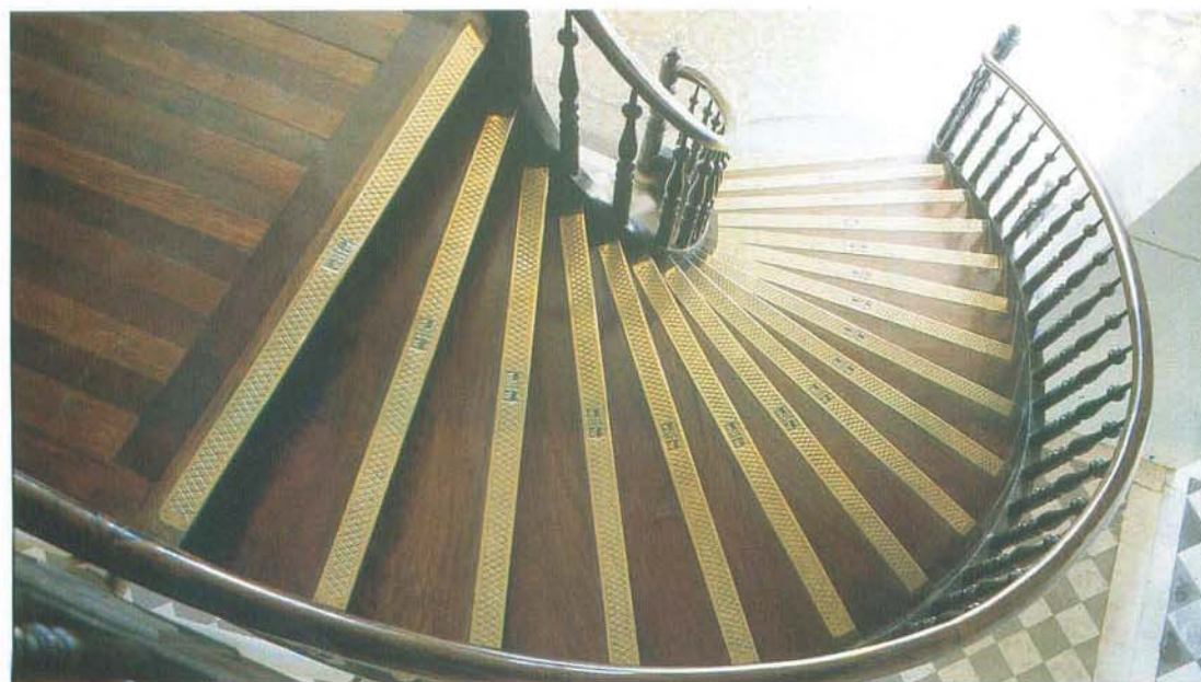
Detalhe da escada de acesso ao saguão superior do hospital.