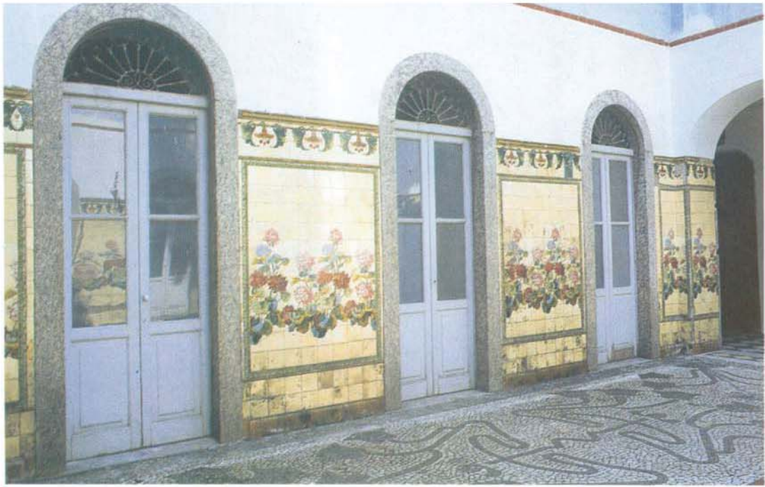
Pátio interno do Hospital Frei Antônio, formado de azulejos e pisos decorados.