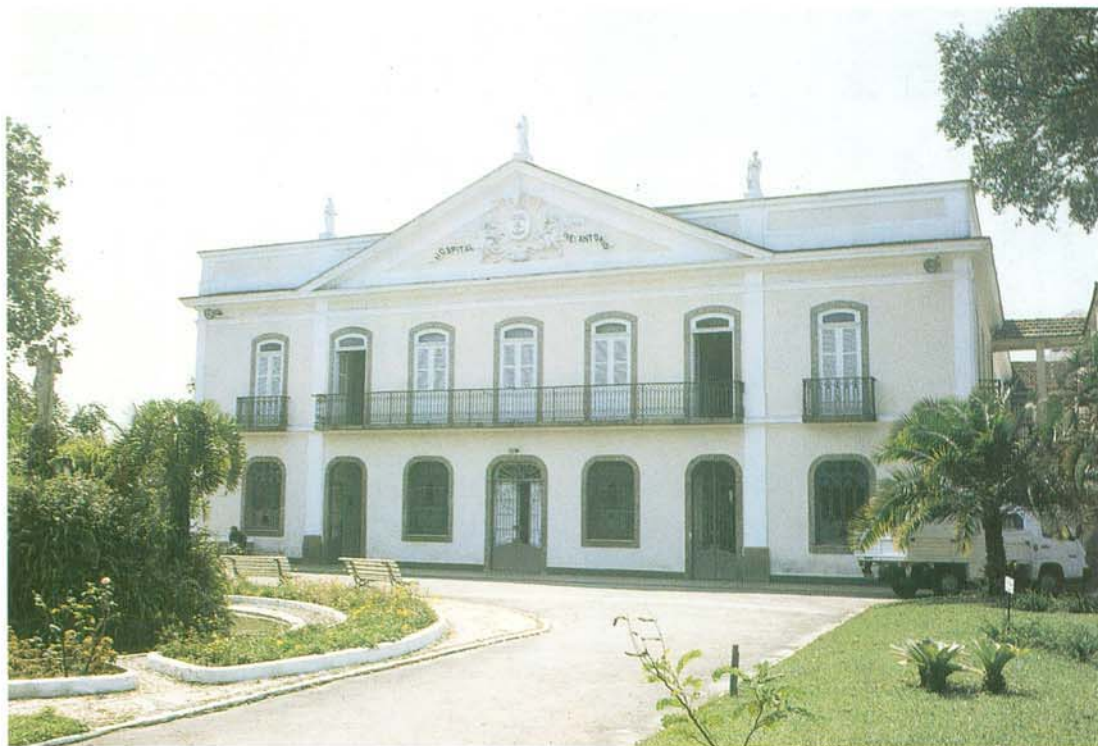
Fachada posterior do Hospital Frei Antônio, um prédio colonial do século XVIII.