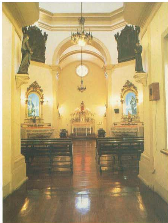
Visão interna da Capela de São Lázaro.