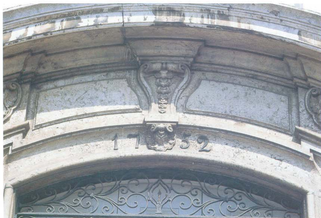
Inscrição sobre granito, na porta principal, com a data de construção do prédio.