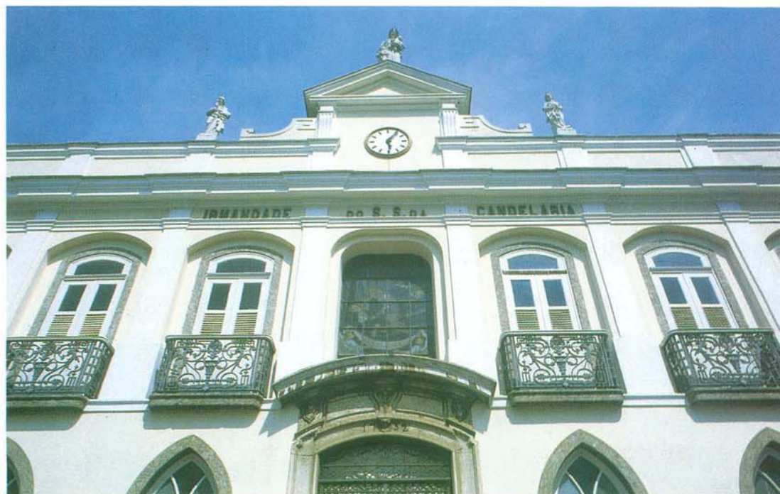
Visão parcial da fachada anterior.