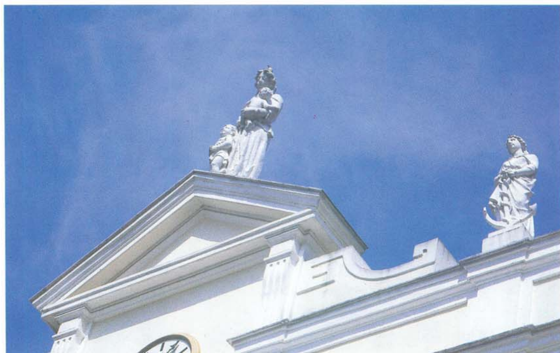
Detalhes dos elementos arquitetônicos de coroamentos da fachada anterior.