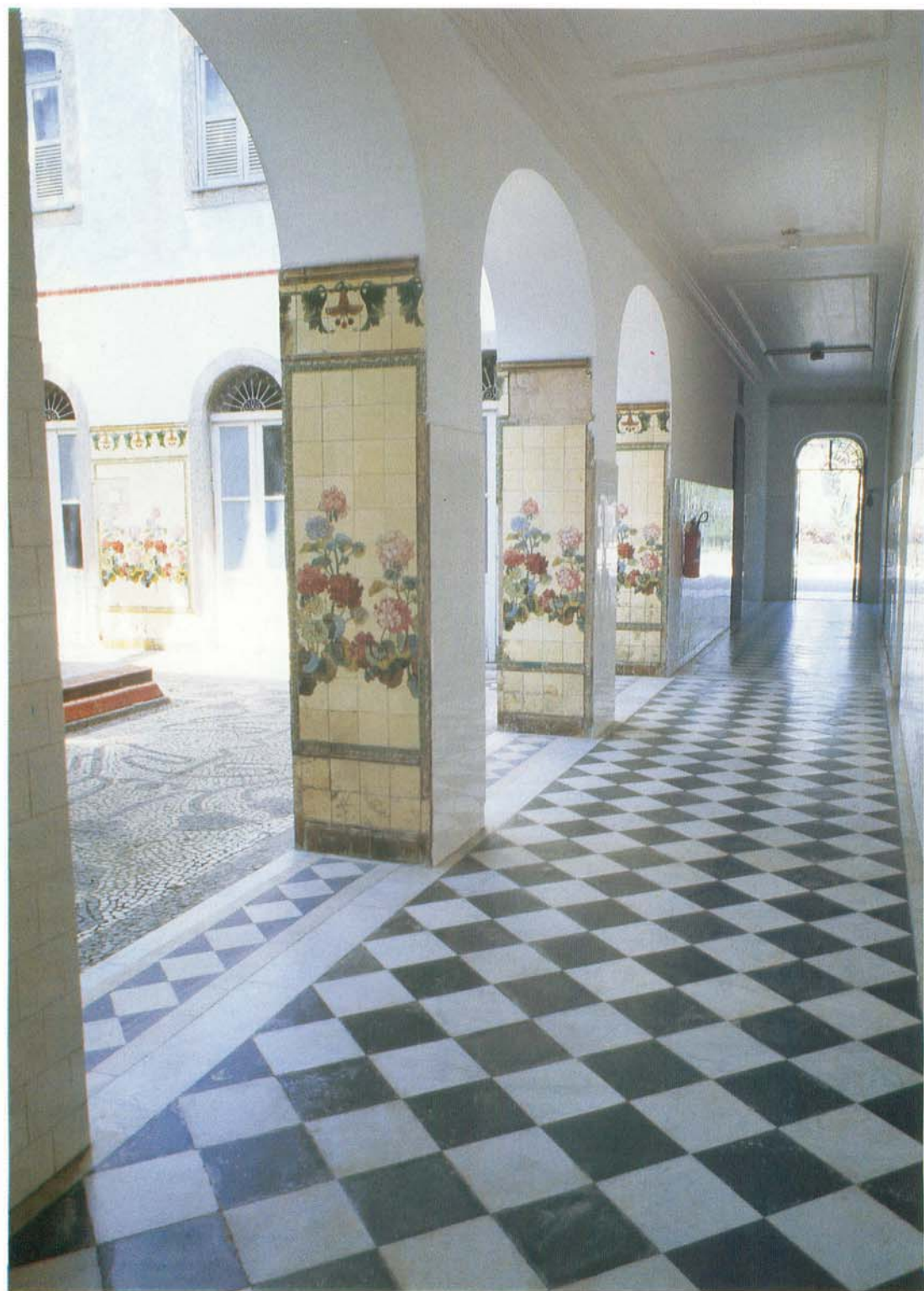
Visão das arcadas, corredores e pátio internos.