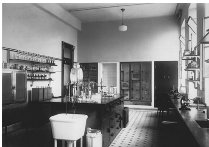
Higiene Rural e Parasitologia.