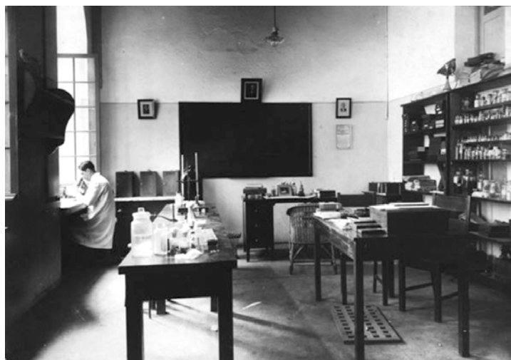
Laboratório de Parasitologia.