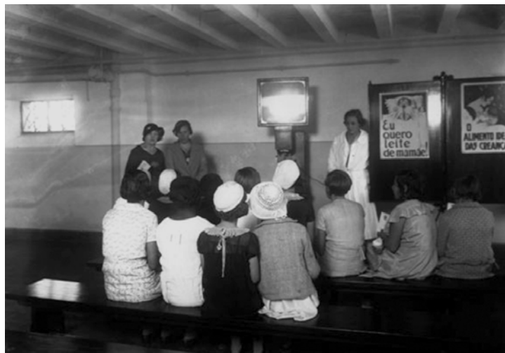
Oficinas de debates sobre higiene.