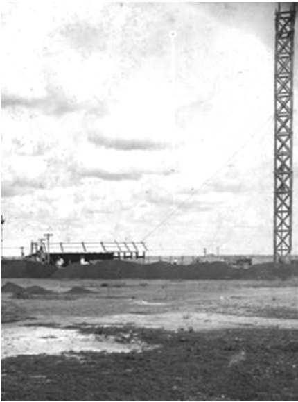
Construção do Instituto de Higiene.