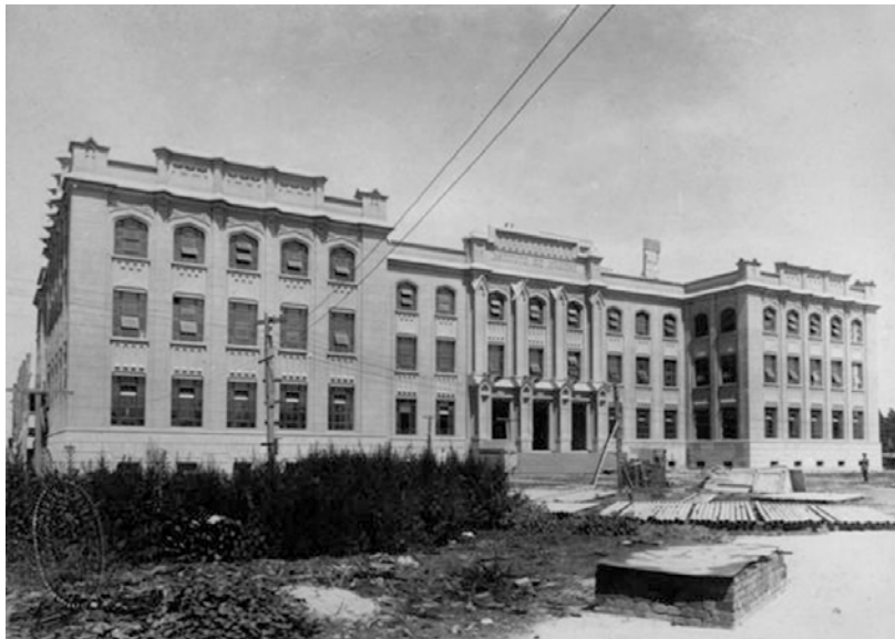
Construção do Instituto de Higiene.