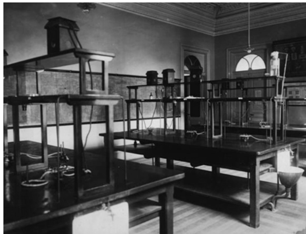
Sala de aulas práticas de higiene do curso médico.