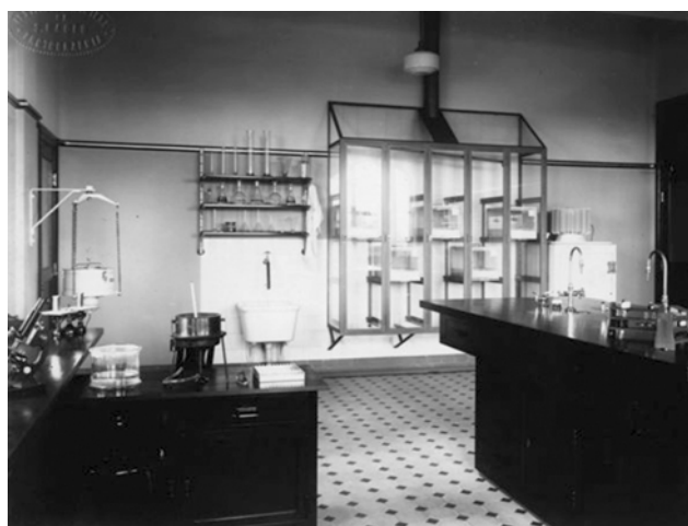
Antigo laboratório de bacteriologia e sorologia, atual laboratório de higiene social.