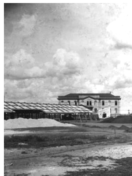
Construção do Instituto de Higiene. Ao fundo, casa que pertenceu a Tarsila do Amaral e Oswald de Andrade. Atual Centro de Saúde Escola Geraldo Horácio de Paula Souza.