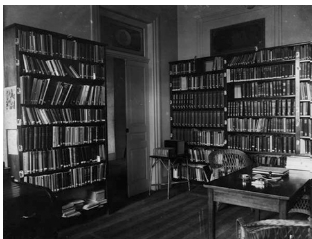
Biblioteca do Instituto de Higiene.