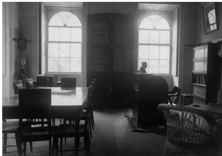
Diretoria do Centro Acadêmico Oswaldo Cruz.