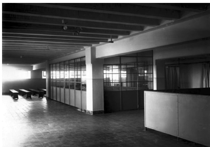
Sala de Educação Sanitária.