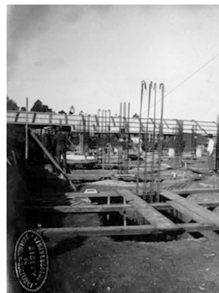
Construção do Instituto de Higiene.