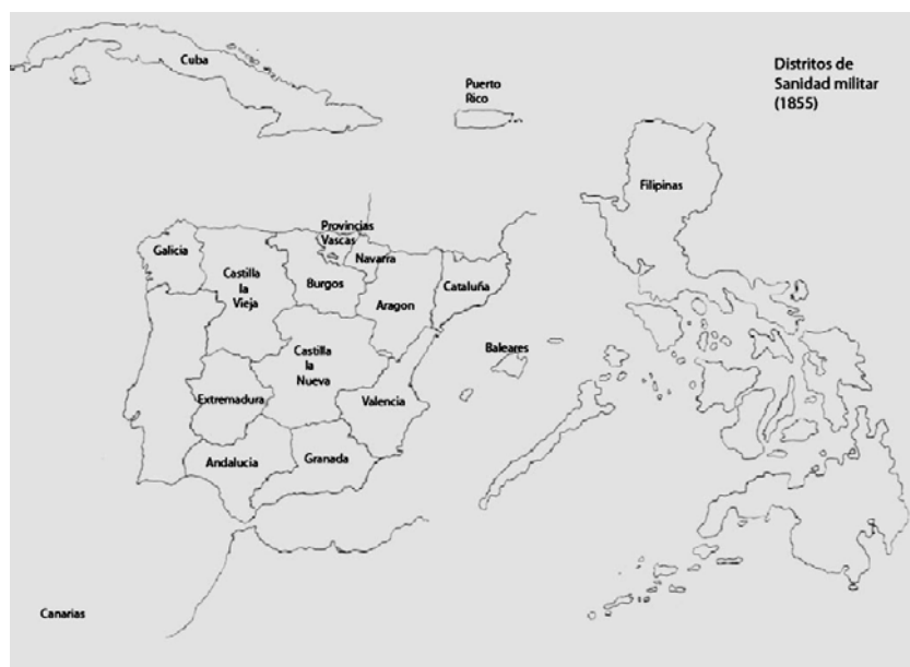
Figura 2 – Mapa de los distritos de Sanidad militar en el Imperio español (1855).

Los jefes de los distritos tuvieron categoría de vicedirectores, primero, y subinspectores, más adelante, y dos o tres de ellos integraban, junto con el Director General, la Junta Superior Facultativa. En el siguiente escalón de la jerarquía se encontraban los jefes de los hospitales militares, situados en las capitales de las Capitanías Generales, en las plazas con gobierno militar y, en otras de menor importancia. La red de hospitales militares del imperio, no obstante la disminución del número total por el cierre de centros en pequeñas localidades o heredados de las dos primeras Guerras Carlistas (1833-1840 y 1846-1849), contaba con más de 50 establecimientos, ordenados en cinco 'clases' distintas según su