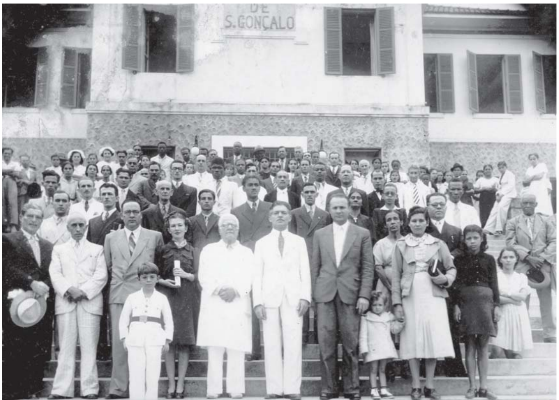
Figura 4 – Legenda original: “A Convenção Batista Gonçalense visitou o Hospital de S. Gonçalo na última 3ª feira”, O São Gonçalo, São Gonçalo, 23 jun. 1940. jun. 1940

Inúmeras e diversas foram as visitas feitas ao Hospital de São Gonçalo, dando-lhe significado como ponto de referência simbólica na cidade. Personalidades, autoridades e grupos vinham conhecer suas instalações. Foram retratados desde membros do clero católico e batista, passando pelo conde Pereira Carneiro e pelo diretor de Higiene de Goiás, até membros do Moto Club Santa Cruz, uma agremiação de motociclistas.