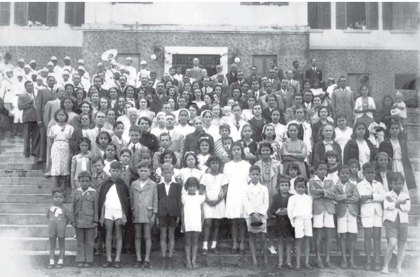
Figura I – Legenda original: “Na escadaria do Hospital. Grupo de pessoas que tomaram parte nas solenidades da inauguração. Médicos, diretores, conselheiros, damas de caridade, associados e funcionários do Hospital”. O Estado , Niterói, 23 ago. 1938. 2

O Hospital de São Gonçalo foi inaugurado em 1934. Quatro anos depois, uma nova ala, abrangendo novos serviços, foi aberta ao público, dando ensejo a novas comemorações. Na época, em agosto de 1938, os principais jornais de Niterói ( O Estado , Diário da