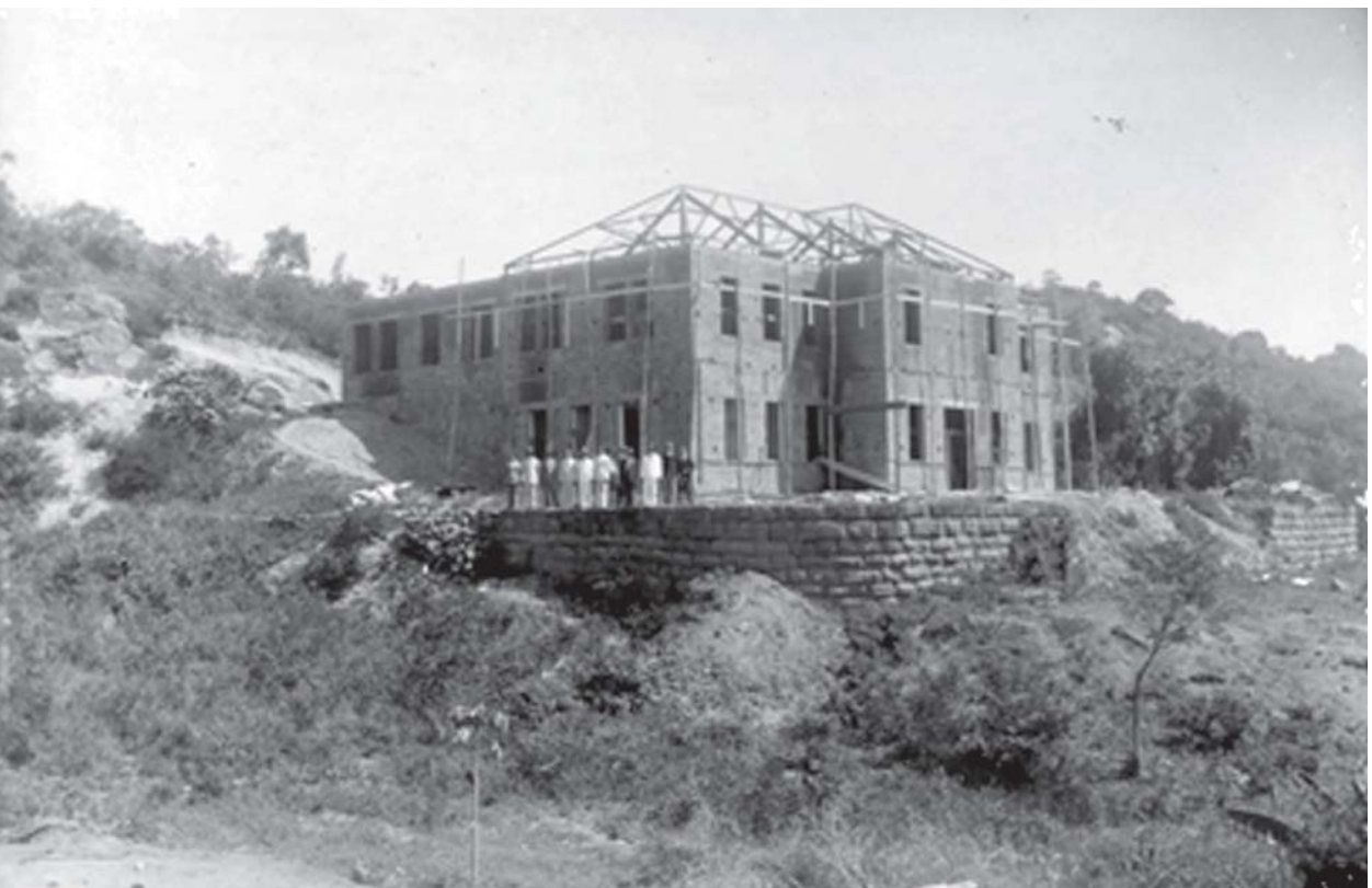
Figura 2 – Coleção Luiz Palmier; série Saúde, subsérie Hospital de São Gonçalo. Sem autoria; data provável, 1933

Na Figura 2, observamos um estágio da construção do Hospital de São Gonçalo. Na imagem, é possível decodificar, por meio da análise iconográfica, certa realidade implícita ao assunto registrado, objetivando apreender melhor sua face visível.