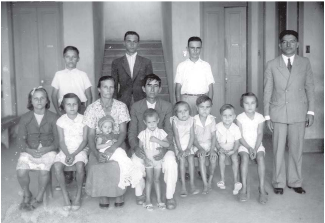
Figura 5 – Legenda original: “Uma família de 13 pessoas, os pais e 11 filhos, todos impaludados, originários de Campos, com passagem por Casemiro de Abreu, todos curados nos ambulatórios do Hospital de S. Gonçalo”. s.d.

A Figura 5 destaca, portanto, alguns trunfos da ‘obra de assistência social’ realizada pelo Hospital. Em primeiro lugar, a atenção particular aos pacientes de malária, denotando esforço para operar em sintonia com as preocupações da época. Em segundo, quanto à origem da família, que é de Campos, região norte fluminense que vinha apresentando manifestações de impaludismo. Por último, mas não menos importante, Palmier quis evidenciar o alcance de atuação