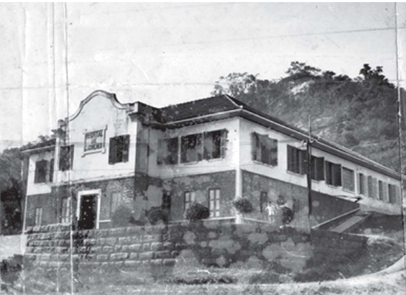
Figura 3 – Coleção Luiz Palmier, série Saúde, subsérie Hospital de São Gonçalo. Sem autoria; 1938

Segundo Lacerda (1994), as reformas urbanas ocorridas no início do século XX no Rio de Janeiro, com vistas à construção da avenida Central, produziram um cenário cuja dinâmica de transformação justificava a produção de uma documentação fotográfica