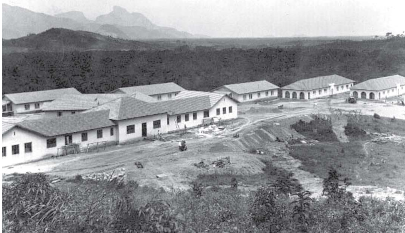
Figura 1: Aspecto de um conjunto de pavilhões da Colônia Juliano Moreira. Fundo Gustavo Capanema. (Centro de Pesquisa e Documentação de História Contemporânea do Brasil/Fundação Getúlio Vargas – CPDOC/FGV)

A disposição dos pavilhões buscava conforto, higiene, aeração e insolação dos ambientes de cura, aproveitando-se a proximidade dos rios, as áreas ajardinadas e a topografia do terreno, conforme o projeto dos hospitais pavilhonares. A arquitetura buscava reproduzir um ambiente familiar, expresso por um ‘aspecto rústico’, ‘de casas comuns’, que, segundo o arquiteto Francisco de Paula Ramos de Azevedo (1851-1928) – autor de diversos projetos em São Paulo para instituições de saúde, conformes à concepção do sistema em pavilhões –, seguia, em 1895, a “prescrição dos modernos alienistas” (cf. Wolff de Carvalho, 2000). Juliano Moreira era certamente um adepto dessa concepção (Figura 1).