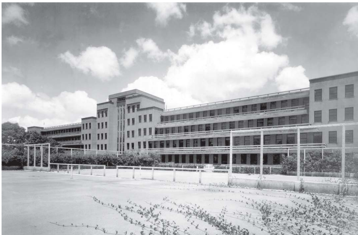
Figura 4: Vista do Sanatório do Sancho, em Recife.

A opção pelos grandes hospitais, caso de Pernambuco e Alagoas, implicava construí-los nos grandes centros urbanos, e não por acaso a solução centralizada de assistência ao trabalhador concentrada nessas capitais fez surgirem os monoblocos de acentuada verticalidade. Tais hospitais apresentavam uma estética que não podemos associar ao movimento