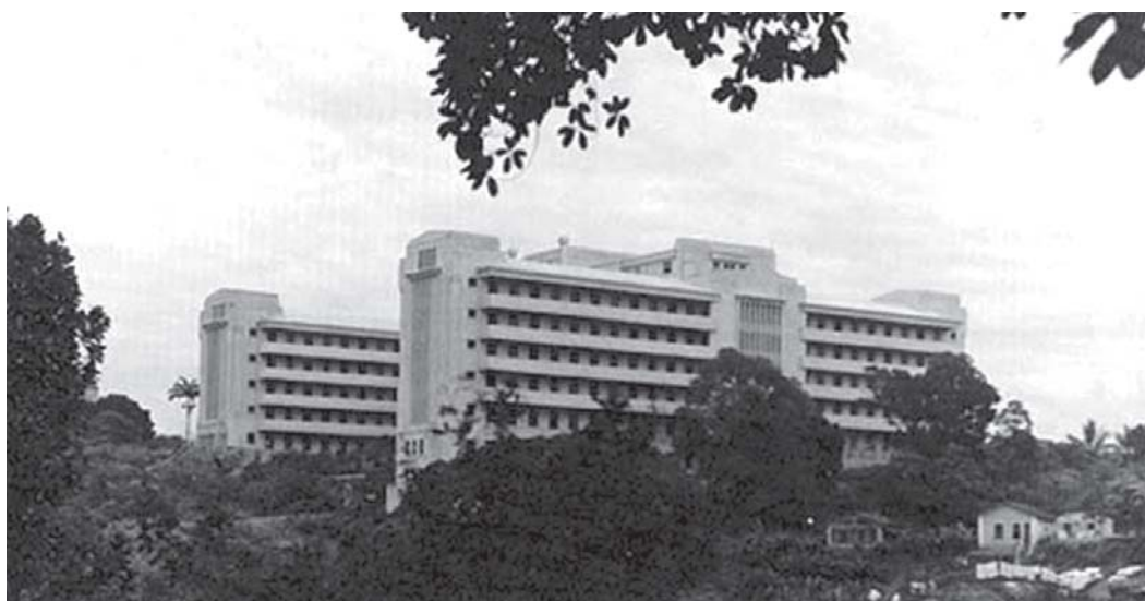
Figura 3: Vista do Hospital das Clínicas de Salvador, construído entre 1938 e 1943.