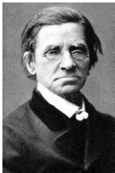
Figura 1: Gravura de Émile Littré por Lafosse (Hamburger, 1988)

Mesmo aqui, onde Littré recorre ao maître da oftalmologia, ele parece estar preocupado em assinalar o seu cuidado historiográfico, que creio ter sido desenvolvido em seu debate bibliográfico com Charles Daremberg, autor de outra edição de Hipócrates e da obra La médecine: histoire et doctrines (1865).