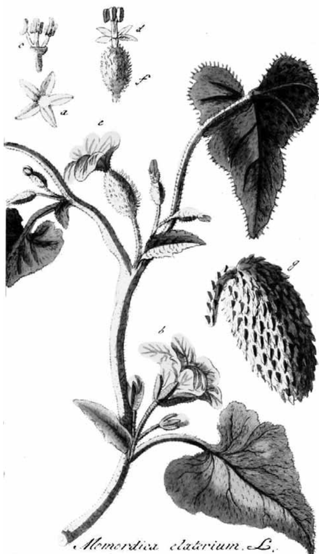
Figura 8: Momordica elaterium (Krauss, 1796, tab.492)

lugar escuro, afastado da fumaça, do fogo e das outras coisas reluzentes, de lado, às vezes do lado direito, outras vezes do lado esquerdo. Não se deve umedecer a cabeça, pois isso não é útil. 22 Cataplasma não é útil na [lesão] indolor que não for interna, como [o é] na fluxão persistente. Nos inchaços indolores e depois dos medicamentos adstringentes besuntados para dor, quando a dor cessar depois da unção do remédio, então é útil aplicar os cataplasmas que te parecerem mais úteis. Não é útil que [a pessoa] olhe fixamente por muito tempo, pois isso provoca lacrimação, não podendo o olho suportar estar diante de nada rutilante; mas não deve fechar [os olhos] por muito tempo, sobretudo se houver uma fluxão quente, pois a lágrima retida esquenta [o olho]. Mas, tendo fluxão, é útil fazer unção com um medicamento seco.