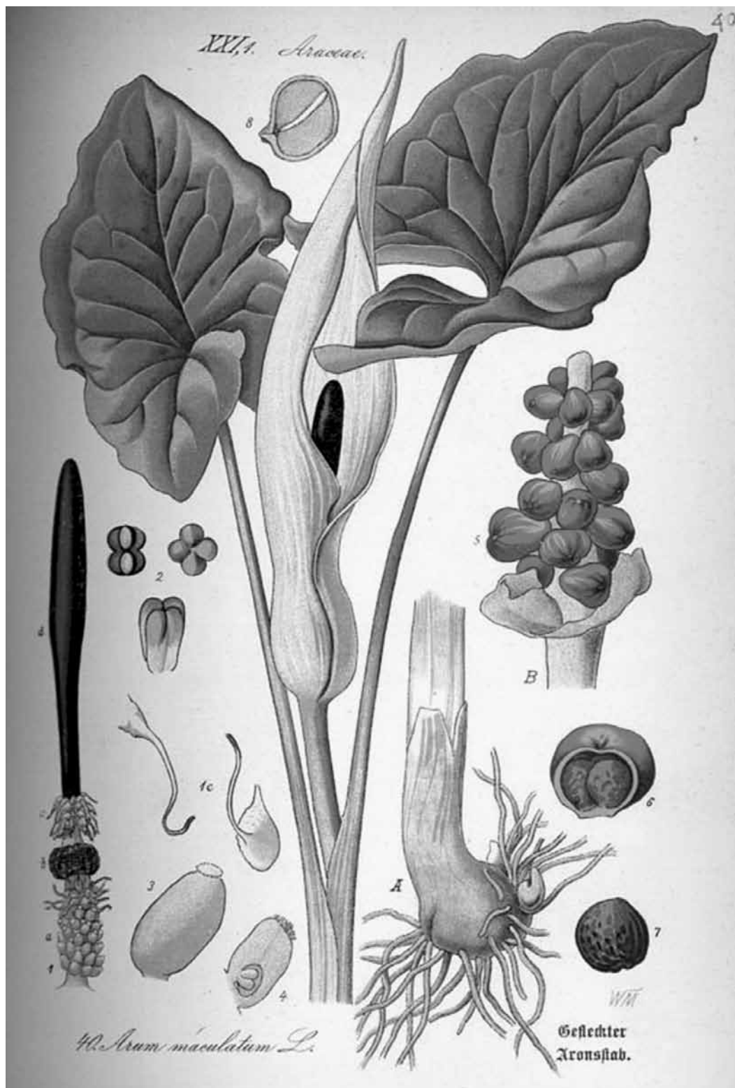
Figura 7: Arum maculatum (Araceae) (Thomé, 1885, tab.40)