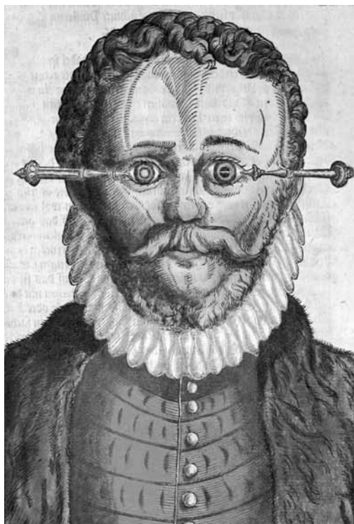
Figura 6: Incisão oftalmológica. Observe-se a cor dos olhos (Bartisch, 1583, l.63)

A definição de νυκταλωπία pode ser tomada do tratado Prorrético (2,33), que lhe dedica um capítulo muito mais explicativo e claro do que o De uisu . O autor do Prorrético começa assim seu pequeno discurso sobre a νυκταλωπία: οἱ δὲ τῆς νυκτὸς ὀρώντες, οὓς δὴ νυκτάλωπας καλέομεν, οὗτοι ἀλίσκονται ὑπὸ τοῦ νοσήματος νέοι (os que vêem de noite, aos quais chamamos de nictalopes, esses são tomados pela doença [ainda] jovens). Assim como o De uisu , o Prorrético relaciona a nictalopia com a lágrima.