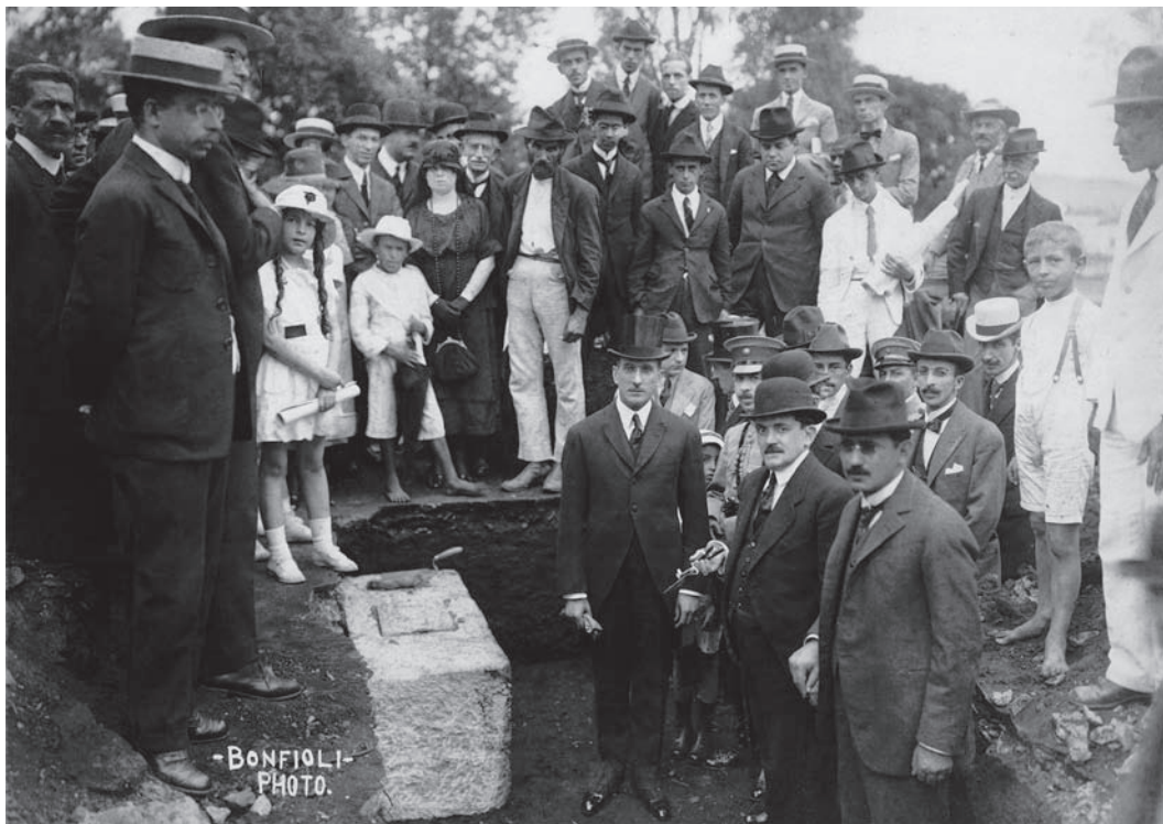
Figura 1: Lançamento da pedra fundamental do edifício do Instituto de Radium, 1921

O decreto n.5.458, de 7 de dezembro de 1920, organizava o Instituto de Radium sob a forma de uma fundação autônoma. Nos termos da lei, em seu capítulo II, artigo 5º, o Instituto gozava de franca autonomia técnico-científica e administrativa: “As rendas do Instituto serão constituídas pelas subvenções que obtiver dos poderes públicos, por donativos e legados particulares e pela renda que lhe vier dos pensionistas do hospital e das aplicações de radium, raios X e substâncias congêneres” (Minas Gerais, 1920).