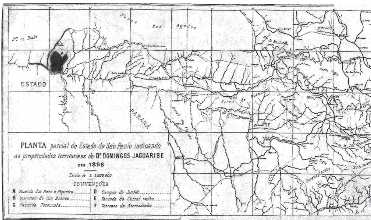
Figura 1: Planta parcial do estado de São Paulo, com propriedades de Domingos Jaguaribe

Também na área médica Jaguaribe Filho estudava e implantava novas – e polêmicas – proposições. Tendo conhecido na Europa o trabalho de Jean Martin Charcot e discípulos, passou a praticar o hipnotismo. Suas experiências de cura do alcoolismo pela hipnose foram apresentadas em revistas e congressos internacionais (Paulo Filho, 1986, p.288). Participou da fundação da Liga Antialcoólica (1904) e fundou e dirigiu, em São Paulo, o Instituto Psicofisiológico (1905). O instituto lidava com a saúde em perspectiva holística e incorporava as ideias delineadas no último trecho de sua dissertação: de acordo com a Revista Médica de São Paulo , era o primeiro “estabelecimento completo” a empregar “agentes naturais” na arte