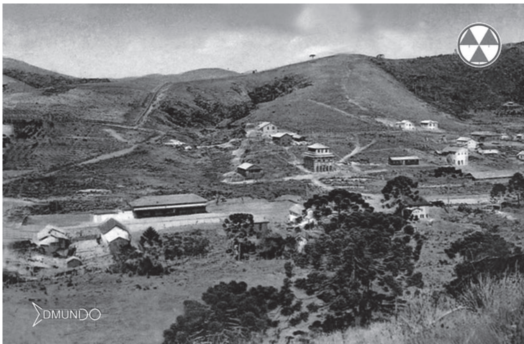
Figura 3: Vila Abernassia, 1919