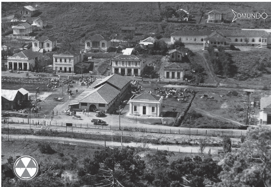
Figura 4: Vila Abernassia, 1930