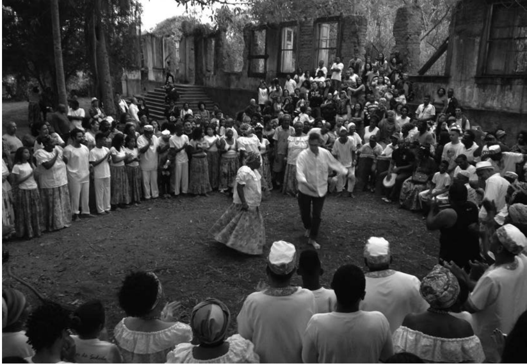
Figura 4: grupo de jongo do município de Pinheiral dança em frente às ruínas do casarão na inauguração do Parque das Ruínas da Fazenda São José do Pinheiro, criado pela prefeitura em 2015 para receber o Memorial Passados Presentes ( www.passadospresentes.com ).