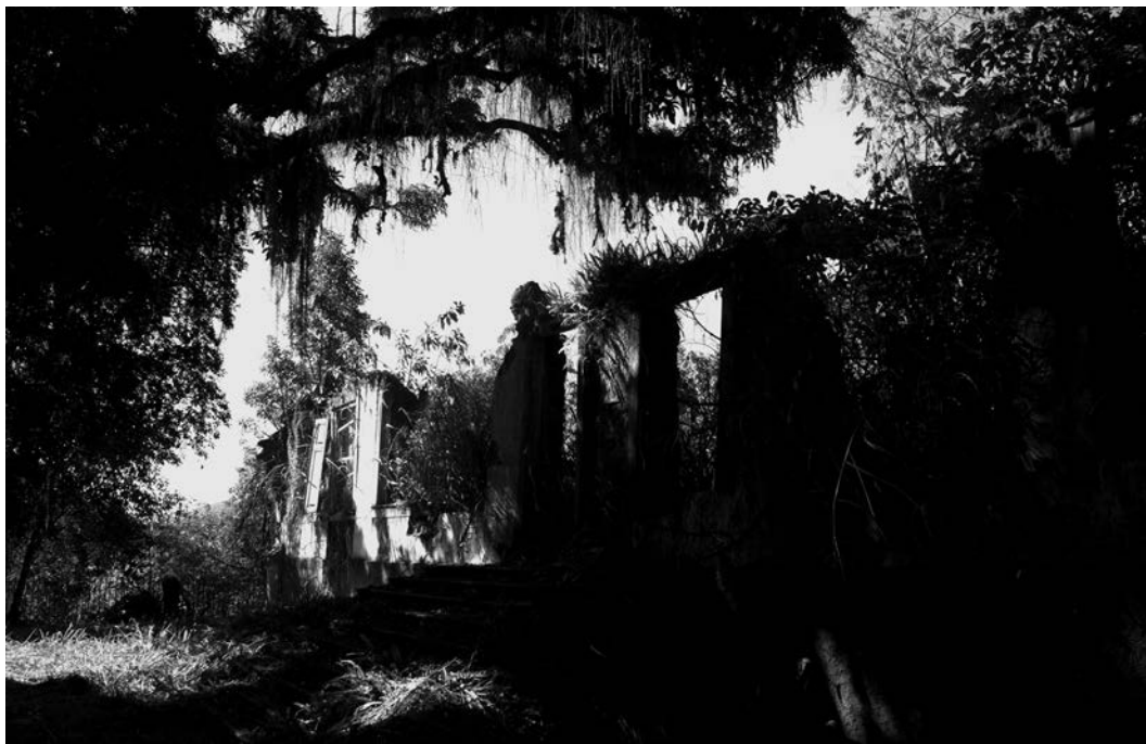
Figura 3: ruínas do casarão de Pinheiral, antiga sede da Fazenda do Pinheiro, de José de Souza Breves. Foto de Guilherme Hoffmann, 2015. Os restos do que foi o imponente casarão, de um dos mais ricos fazendeiros de café do Brasil na segunda metade do século XIX, representam a cultura material da velha sociedade do café ainda presente no vale do Paraíba. O local é palco de muitas histórias contadas sobre o passado, além de histórias atuais, de caráter místico, que são abordadas no filme Passados presentes (2011).