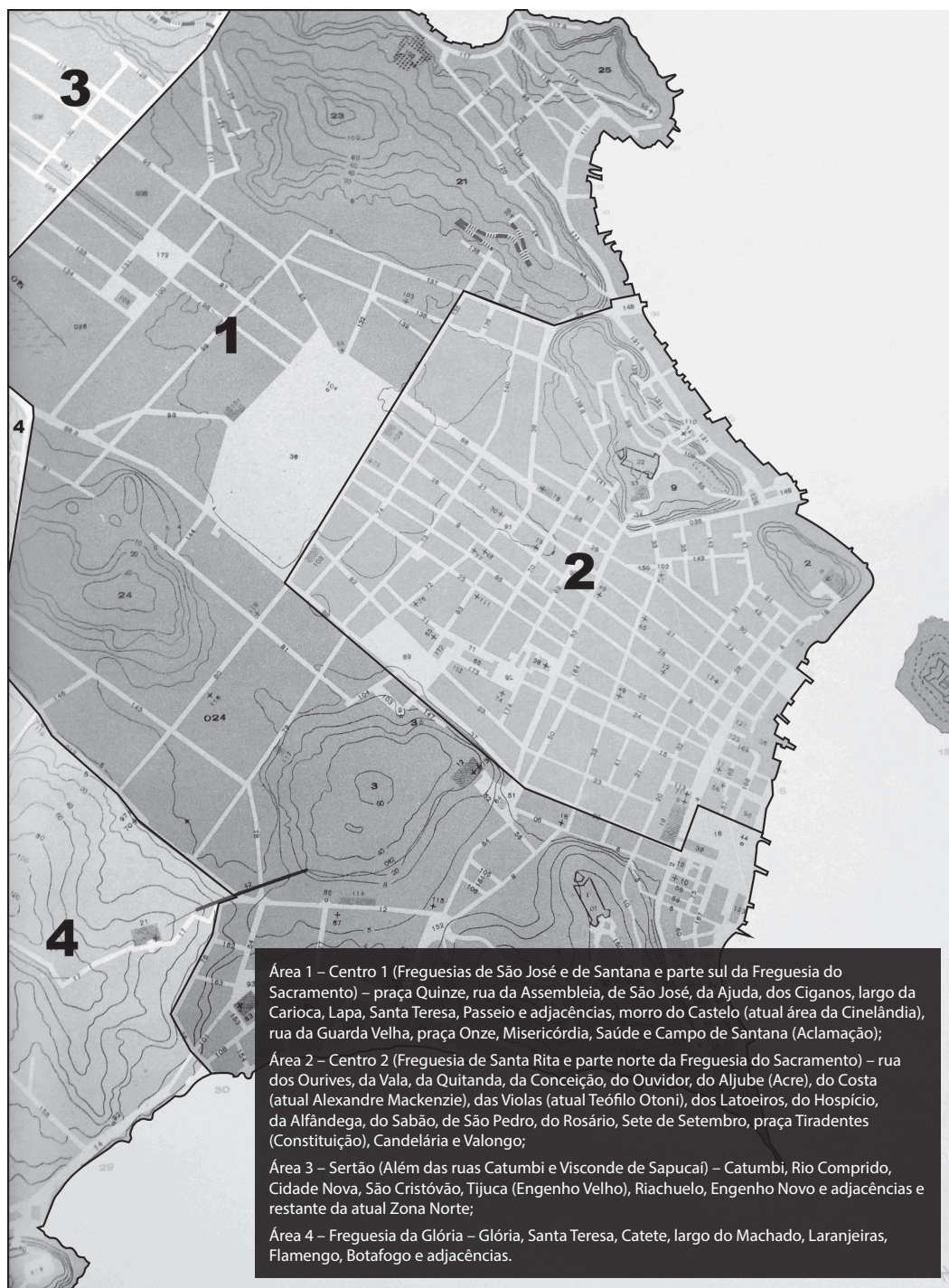
Figura 1: “A cidade do Rio de Janeiro nos meados do século XIX, baseada na Planta Garnier de 1852”