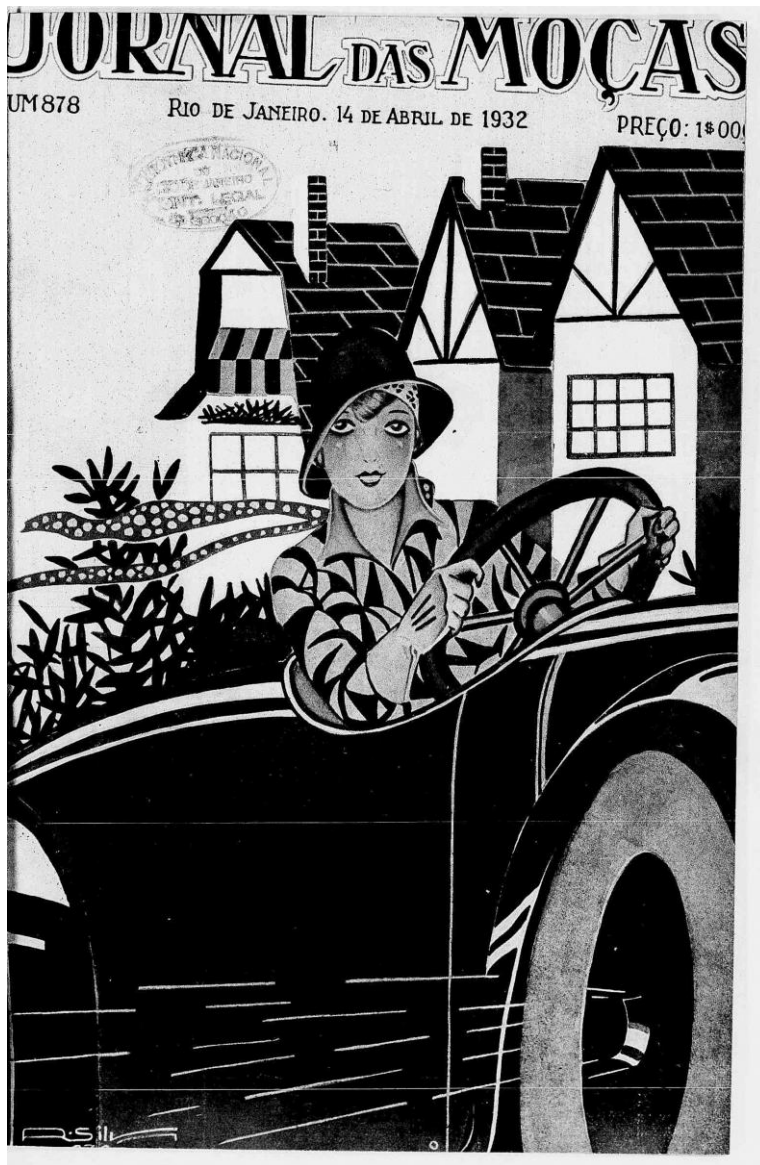
Imagem 1: Jornal das Moças , 14 de abril de 1932.